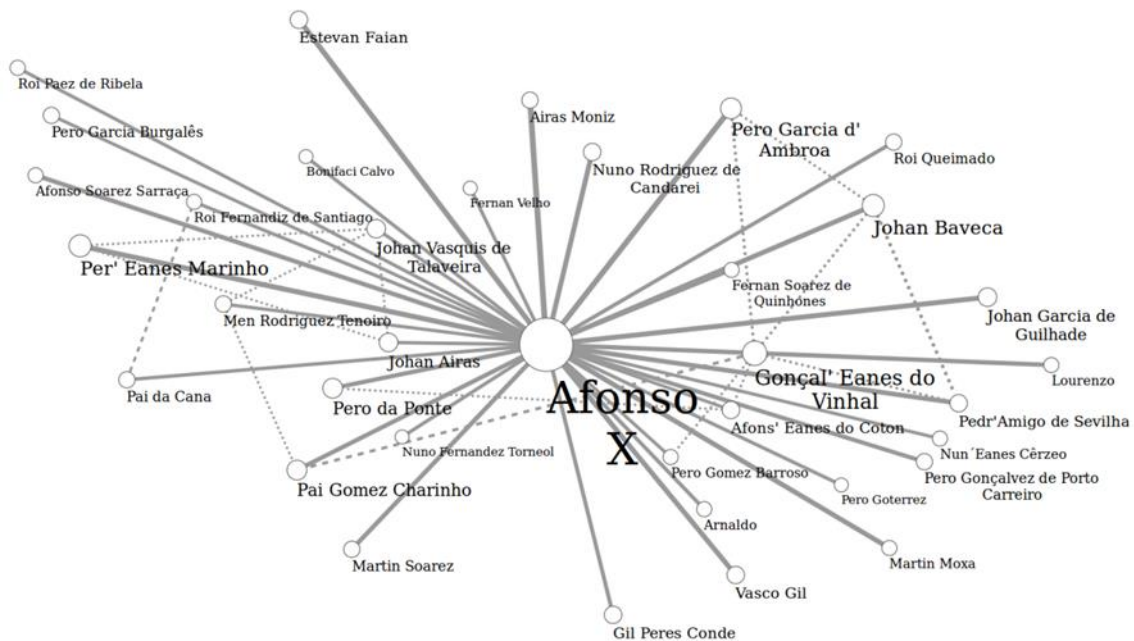
Figura 5. Nó de Afonso X e vínculos inmediatos