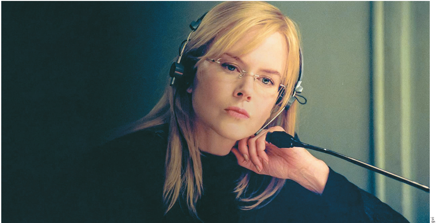
Sprachmittler/innen brauchen sehr spezifische Kompetenzen: Denn gesprochen wird in der Alltagssprache, in Dialekten, Regiolekten oder gar mit kodierten Begriffen aus dem Milieu der abgehörten Personen. (Bild: Nicole Kidman in «Die Dolmetscherin», 2005)

eine Schwierigkeit, doch das Verstehen des Inhalts die andere. Sie ist noch grösser, wenn es nicht um abgespeicherte Textnachrichten geht, sondern um mündliche Gespräche. Der erste und wichtigste Überwacher ist dann jeweils ein/e Dolmetscher/in oder, wie wir diese Berufsgruppe bezeichnen: ein/e Sprachmittler/in. Wie sehr die Strafverfolgungsbehörden von diesen Personen abhängig sind, wird meist viel zu wenig beachtet.