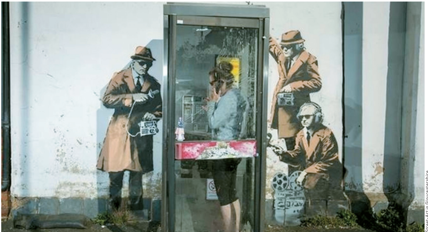
Street-Art in Gloucestershire

«Der technische Zugang ist die eine Schwierigkeit, doch das Verstehen des Inhalts die andere.»