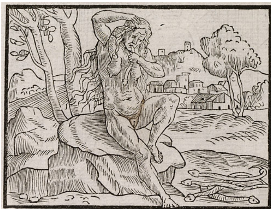
Figura 5. Invidia. Alciato, Emblematum libellus , Venecia, Aldus, 1546, fol. 35v. Ejemplar de la Glasgow University Library (SM29).

En suma, Lope adoptó la imagen de genio atacado por la envidia, a la que solo respondía con su humildad característica, desde el comienzo mismo de su carrera, desde el primer retrato suyo que hizo imprimir y que difundió en los años de entresiglos, el de la Arcadia . Para expresar esta idea recurrió a una representación iconográfica (la caña frente a la serpiente) que combinaba dos elementos con origen en la literatura clásica y muy difundidos en su tiempo: la humilde caña que triunfa sometándose procedía de la fábula esópica del roble y la caña; la naturaleza ofídica y devoradora de la envidia, de las Metamorfosis de Ovidio. Mediante este icono y mediante constantes repariciones de los motivos de la caña humilde y de la envidia, Lope les recordaba a sus contemporáneos quién era él, por qué tenía tantos enemigos y por qué no recibía las recompensas que merecía. Con la caña y la serpiente, Lope cultivó la imagen del genio humilde, idea que consideraba que le caracterizaba y que le permitía censurar los excesos de sus conciudadanos, como hizo en “A mis soledades voy”.