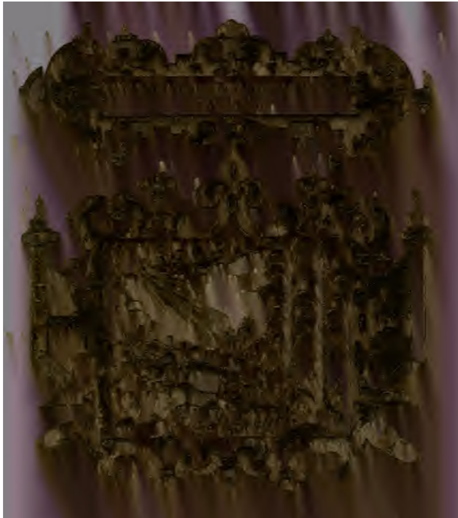
Figura 1. Superbis resistit humilibus dat gratiam . Juan de Borja, Empresas morales , Bruselas, Francisco Foppens, 1680. Ejemplar de Archive.org.

Del mismo modo, en la “Canción al beato Francisco de Borja”, de La vega del Parnaso , el narrador explica cómo el beato hizo “de una caña mil laureles” (vol. II: 426, v. 50) al humillarse al poder divino y conseguir así la gloria y la salvación.