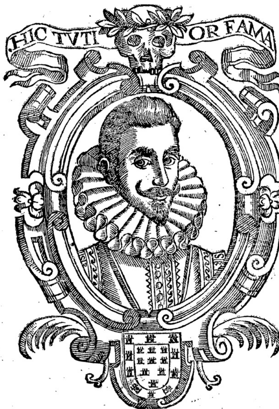
Figura 3. Retrato de Lope de Vega. Arcadia , Madrid, Pedro de Madrigal / Juan de Montoya, 1602-1603. Ejemplar de la Hispanic Society of America.

Este último retrato llevaba ya incorporado el polémico escudo heráldico de los Carpio, que en la Arcadia aparecía en la portada y que también es esencial para entender la imagen de sí mismo que quería proyectar Lope en estos comienzos de su carrera (ver Figura 4).