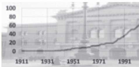
Modifications législatives du CO (1911-2012)

L'évolution au sein du Code concerne les modifications effectives du texte du CO. Si l'on inclut la révision du droit commercial de 1936, un peu moins de cent modifications législatives touchant un ou plusieurs articles du CO ont eu lieu et plus de la moitié d'entre elles se sont produites au cours des vingt dernières années. 15 Cela démontre que le Code vieillit et qu'il nécessite de plus en plus régulièrement des interventions du codificateur. Certaines modifications sont peu importantes. C'est le cas de la dernière en date, qui a eu lieu le 1 er octobre 2012 et qui se contente d'ajouter quelques mots à l'article 455 alinéa 3 CO en raison de la libération des services postaux. D'autres modifications