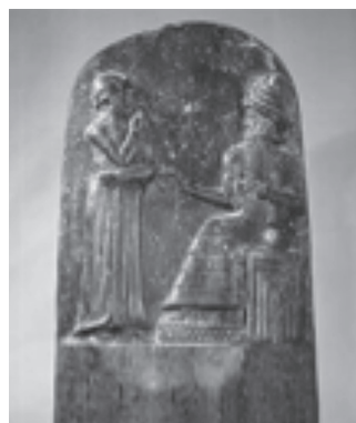
Code d'Hammourabi (1780 av. J-C)

Le code a une longue histoire . Dans l'antiquité, on trouve déjà le Code d'Hammourabi (1780 av. J.-C.), gravé sur une stèle. Un saut de plusieurs siècles et on tombe sur les codes de l'époque romaine, notamment celui de Justinien promulgué en 529 qui rassemblait des constitutions impériales. Les codes romains étaient présentés sur des feuilles de parchemin reliées ensemble par un côté, une manière de présenter les textes appelée codex . La désignation du contenu s'est appliquée par métonymie au contenant. Plus proche de nous, il y a le fameux Code Napoléon, le Code civil français de 1804.