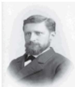
Eugen Huber (1849-1923)

peu de dispositions ; les articles devaient être brefs et exprimés simplement et clairement ; le texte devait contenir le moins possible de renvois internes ou externes. Il en résulte un code accessible au profane, « ce qui n'empêchera pas le spécialiste de (...) découvrir toujours un sens plus étendu ou plus profond ». 11