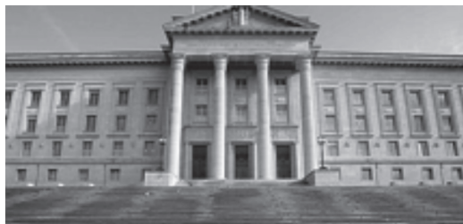
Tribunal fédéral, Lausanne

La jurisprudence est l'autorité qui se dégage des décisions rendues par les Tribunaux. Lorsqu'un juge doit résoudre une question, il consulte certes le Code. Parallèlement, il a un réflexe naturel consistant à chercher si un tribunal, de préférence de rang supérieur, n'a pas déjà tranché la même question. Les juges, tout en