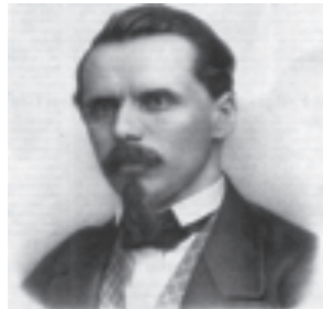
Walther Munzinger (1830-1873)

Troisièmement, le Code des obligations – et c'est principalement là un acquis du premier texte de 1881 et une grande différence avec le Code civil suisse de 1907 – a unifié le droit suisse des obligations en se détachant des particularismes cantonaux. Munzinger s'est efforcé de rédiger un droit unifié et pragmatique offrant un cadre juridique répondant aux besoins d'une pratique marquée par de nombreux échanges commerciaux. S'inspirant à la fois des traditions allemande et française tout en n'étant soumis à aucune d'elles, Munzinger a retenu les règles les plus pertinentes pour garantir un juste équilibre entre les parties au contrat. 8