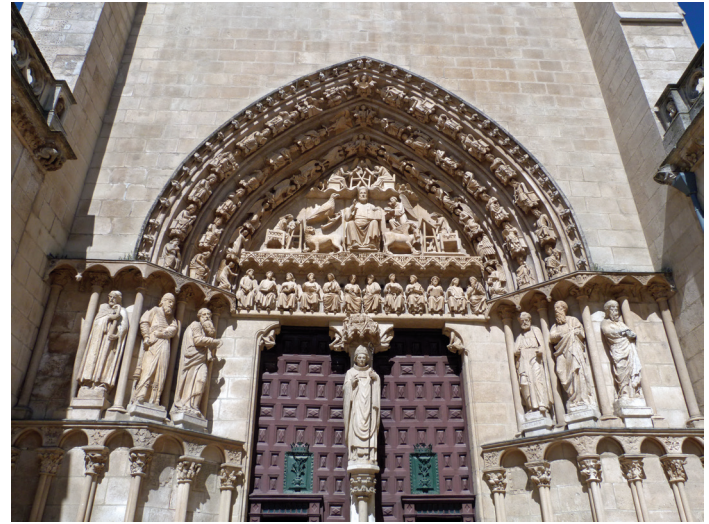
Fig 4. Cathédrale de Burgos, Puerta del Sarmental, portail du bras sud du transept, vers 1240.

maximum de ses possibilités. Il est désormais établi, grâce aux recherches et aux débats de ces dernières décennies, que les vestiges médiévaux étaient accessibles de manière continue au nord comme au sud des Alpes, sur l'ensemble des territoires conquis par les Romains. Ces vestiges furent considérés différemment selon les périodes et les régions ; chaque phénomène de résurgence comporte ses implications et ses modalités propres. Si depuis quelques décennies la tendance est d'expliquer l'appropriation formelle des œuvres antiques par des raisons idéologiques, le critère esthétique doit encore être accepté.