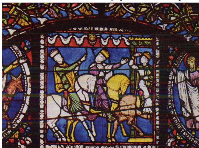
Fig 1. Canterbury, cathédrale, bas-côté nord, vitrail, le voyage des rois mages, vers 1180.

La thématique considérée, l'Antiquité dans l'art médiéval, est dotée d'une imposante tradition historiographique dont le point de départ se situe au XIX e siècle. Le terme de media aetas naquit sous la plume de Pétrarque pour désigner ce long temps intermédiaire entre la fin de l'Antiquité et son époque, le XIV e siècle 1 . Deux périodes intellectuellement fastes au milieu desquelles s'est inscrite une ère qui aurait fait abstraction de son héritage classique. Or, à partir du XIX e siècle, les érudits mirent en exergue les rapports qui unissent certaines œuvres médiévales à la production antique. On trouve à ce moment-là les premières mentions d'œuvres médiévales louées pour leur ressemblance à des œuvres de l'Antiquité grecque. John Gilbert, un explorateur britannique, admirait en 1842 les vitraux de Canterbury et, en observant les chevaux accompagnant les rois mages, se