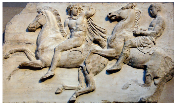
Fig 2. Fragment provenant de la frise ouest du Parthénon, Londres, British Museum (Wikimedia).

référait à la beauté grecque des reliefs du Parthénon 2 (Fig. 1 et 2). Bien entendu, la comparaison lui vint à l'esprit par la présence à Londres des marbres grecs rapportés par Lord Elgin une quarantaine d'années plus tôt. Simultanément, les expéditions archéologiques en Grèce démarrèrent et c'est tout naturellement qu'au même moment le retable de Klosterneuburg de Nicolas de Verdun fut rapproché des sculptures de Phidias au Parthénon ou que plus tard André Michel (1906) établit un parallèle entre le groupe de la Visitation de Reims et une stèle grecque acquise par le Louvre 3 . Ces premières comparaisons n'allèrent en revanche pas au-delà de la mise en lien d'œuvres médiévales à des œuvres antiques. Ce n'est véritablement qu'à partir des années 1930 que démarra et se développa l'analyse globale des rapports que l'art médiéval entretint avec son passé classique. Les travaux d'Erwin Panofsky, de Fritz Saxl, de Jean Adhémar, puis de Jean Seznec fournirent les clés de réflexion et la base de toutes les études ultérieures.