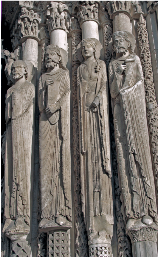
Fig 3. Chartres, cathédrale, façade occidentale, portail central, ébrasement de droite, statues-colonnes, années 1140.