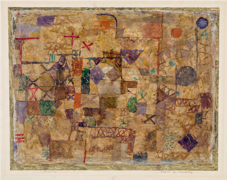
Abb. 1 Paul Klee, Teppich der Erinnerung , 1914, 193, Ölfarbe auf Grundierung auf Leinen auf Karton, 37,8/37,5 × 49,3/50,3, Zentrum Paul Klee, Bern

reinen Malerei, der reinen Plastik und der reinen Architektur zu beschäftigen. [...] Das Thema «Material» kommt deshalb in Mode. Erst vor kurzem fand der Künstler Gefallen an der Arbeit mit Glas, Eisen, Blech, Zement, Asphalt u. a. Der Maler klebt in seine Bilder mutig Ausschnitte aus Zeitungsblättern; dieses unbearbeitete Stück Leben, dieses «Material» steht ihm näher als die Farben auf der Palette [...]. 11