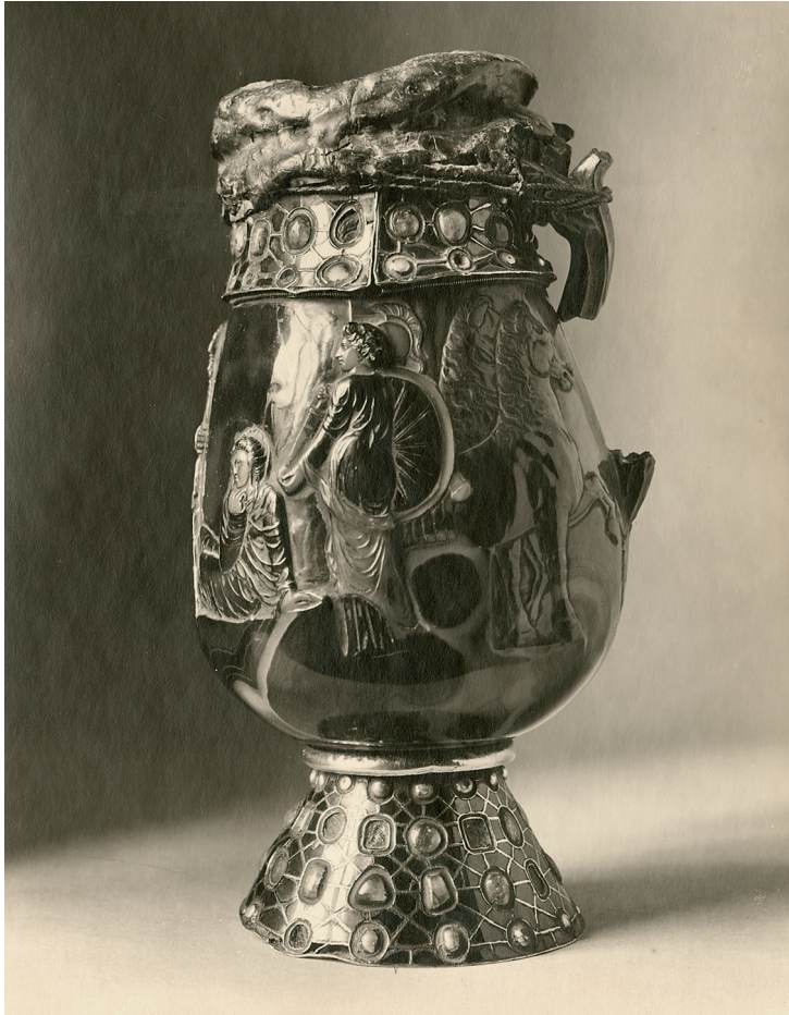
6 Vase de saint Martin (inv. 4), état avant 1923.

en contournant l'autel, mais seulement lors des processions qui en font le tour 34 .