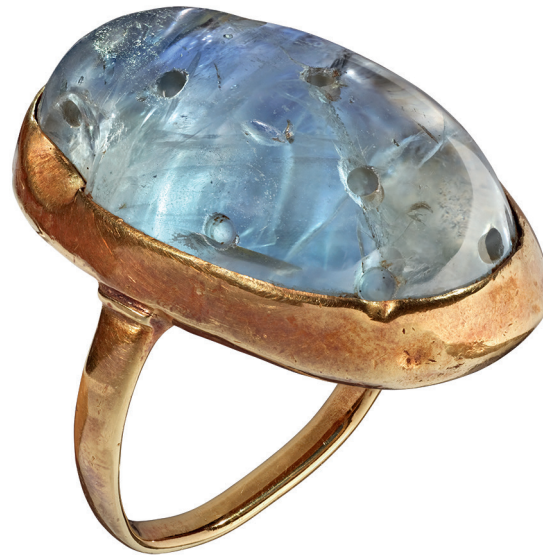
1 Saint-Maurice, église paroissiale de Saint-Sigismond, Châsse de saint Sigismond, Suisse occidentale ?, vers 1365.

A Saint-Maurice, des ostensions sont organisées dès le XVII e siècle au moins, même si nous n'en gardons pas de trace écrite directe 18 . L'inventaire des possessions « tant sacrées que domestiques », rédigé le 7 août 1765 sous l'abbatiate de Jean-Georges Schiner (1764-1794), débute par la description des objets conservés au trésor. Dans les tout premiers