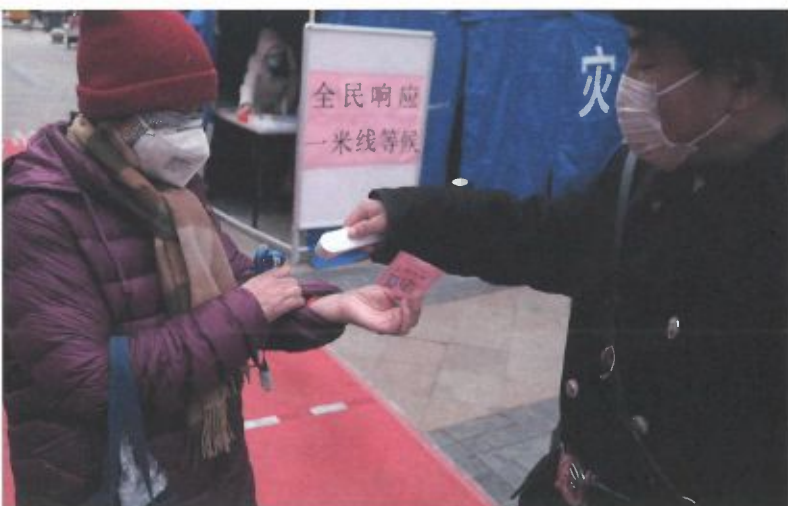
Prise de température, Pékin

soustraire », explique Xiaowei Sun. De lourdes sanctions sont appliquées en cas de fausses déclarations, pouvant aller jusqu'à la prison ferme si elles sont sources de menace pour la santé publique. La mise en œuvre d'une telle mesure est susceptible de porter atteinte à la liberté de circulation des personnes, elle intervient cependant dans un contexte où la sécurité publique prime. « La Chine, profondément marquée par l'épidémie de SRAS en 2002-2003, affiche la volonté d'atteindre l'objectif de zéro cas de SARS-CoV-2 sur son territoire. Cela explique qu'à Pékin, en juin dernier, la crainte d'une nouvelle vague ait été immédiatement maîtrisée par des mesures drastiques de confinement et un dépistage massif, alors que 30 cas seulement, seulement pour un regard d'Occidental, avaient été recensés dans l'un des quartiers de la capitale. » Le code QR de santé a été expérimenté pour la première fois dans la ville de Hangzhou dès le 11 février 2020. Il a donné lieu à un cadrage national en avril pour être étendu à l'ensemble du territoire national en répondant aux exigences de compatibilité des systèmes informatiques et de transparence du procédé.