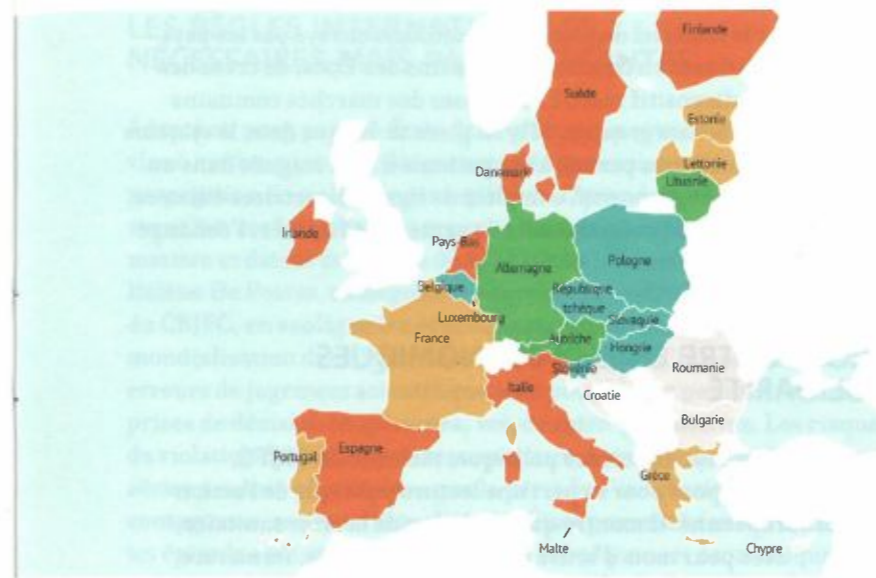
● Plus de 5 lits de soins aigus pour 1000 hab. ● Entre 4 et 5 lits de soins aigus pour 1000 hab. ● Entre 3 et 4 lits de soins aigus pour 1000 hab. ● Entre 2 et 3 lits de soins aigus pour 1000 hab. ● Non renseigné