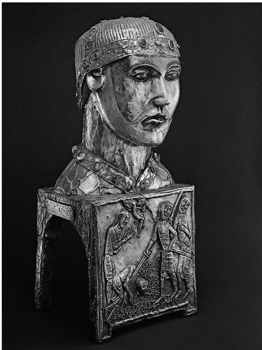
Fig. 3: SAINT-MAURICE D'AGAUNE, Trésor de l'abbaye, Buste-reliquaire de saint Candide, vers 1165.