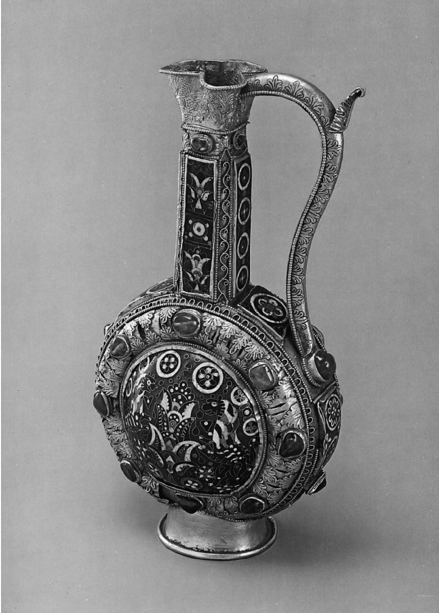
Fig. 2: SAINT-MAURICE D'AGAUNE, Trésor de l'abbaye, Aiguière dite de Charlemagne, VIII e siècle.