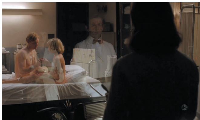
Un couple de volontaires pour l'expérience de coït en laboratoire (saison 1, épisode 1)

un facteur d'intercompréhension et la source d'une harmonisation possible des plaisirs (un principe fondateur de la clinique sexologique mise en place ultérieurement par Masters et Johnson). Ainsi, cette nouvelle conceptualisation médicale de la sexualité ne porte-t-elle pas atteinte à l'institution du mariage ni à la matrice hétérosexuelle de la sexualité. Forts de leurs observations du coït hétérosexuel en laboratoire, Masters et Johnson mettent en effet au point une méthode thérapeutique en faveur de la sexualité conjugale, faisant du couple (et non de l'individu) leur cible et leur «patient» privilégié.