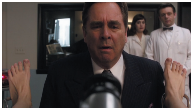
Observation d'un orgasme féminin en laboratoire (saison 1, épisode 1)