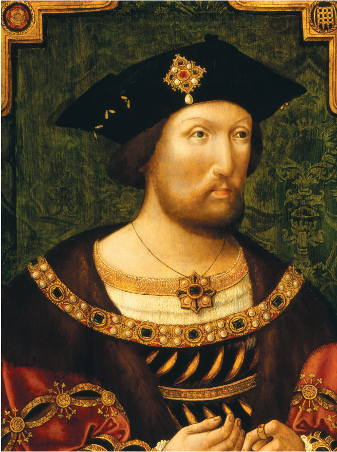
Portrait d'Henri VIII. Anonyme, vers 1520

considère que sa série n'en offre pas moins un regard sur l'histoire. Dans tous les cas, il est remarquable que la trame narrative de la série soit suffisamment efficace pour nous faire adhérer pleinement à cette représentation, aussi iconoclaste soit-elle, puisqu'Henri VIII dans The Tudors ne saurait finalement avoir un autre visage que celui de l'acteur qui l'incarne.