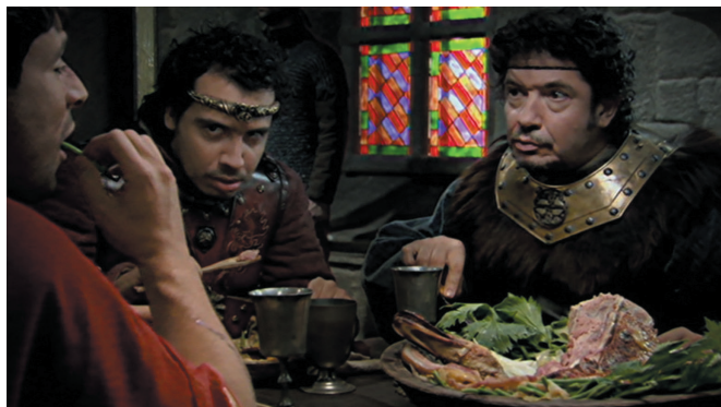
Le dernier empereur (Livre I, épisode 56)