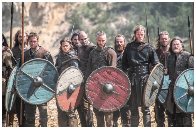
Une reconstruction soignée mais modérément fiable

Or, reconstruire l'histoire religieuse de la Scandinavie du VIII e siècle à partir de ce que nous – en l'occurrence, les scénaristes de Vikings mais aussi les Scandinavistes – appelons des mythes (le mot n'appartient en effet pas au vocabulaire scandinave), comporte certains risques. Ces derniers sont de deux ordres. Le premier tient à l'âge des sources. Bien qu'elles s'expriment sur des sujets préchrétiens, ces sources elles-mêmes datent pour la plupart du XIII e siècle, soit plus de deux siècles après la conversion au christianisme. Snorri, notre plus grand mythographe, rédige son traité dans les années 1220. Que peut-il nous apprendre sur la religion de Ragnarr Loðbrók, de quelque cinq siècles plus ancienne ?