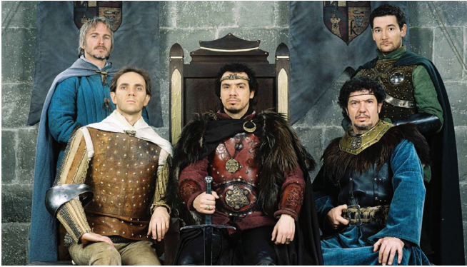
Perceval, Lancelot, Arthur, Léodagan et Bohort

De quelle manière, alors, par le biais de l’humour, la série Kaamelott dévoile-t-elle une réelle réflexion sur l’histoire, la littérature et la transmission d’un patrimoine? Cette question jalonna notre courte recherche, au travers de laquelle nous tenterons de mettre en regard certaines sources médiévales et la version qu’en propose la série, afin de définir son rapport à l’histoire et à ses documents, rapport dans lequel résident précisément toute la subtilité et l’originalité du projet Kaamelott .