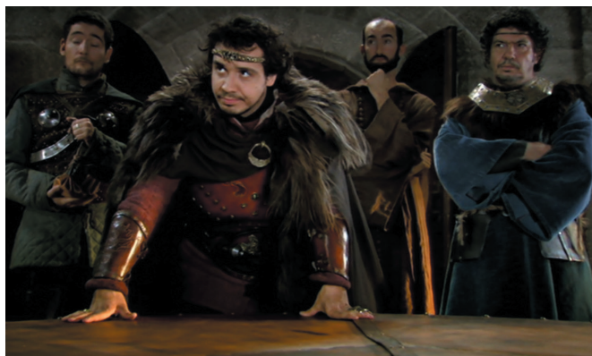
La table de Breccan (Livre 1, épisode 3)