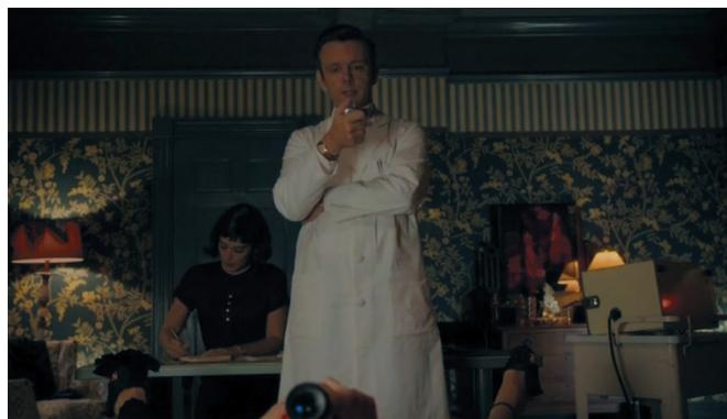
Enquêter auprès des prostituées (saison 1, épisode 3)

en termes de décalage et de déstabilisation des situations et des frontières 6 . Ce dont il s'agit, c'est de transporter au propre comme au figuré le dispositif expérimental (les sciences de laboratoire) au bordel et de le faire avec tout le sérieux que doit revêtir une science positive, attentive à recueillir des données fiables, à les compiler et les exploiter.