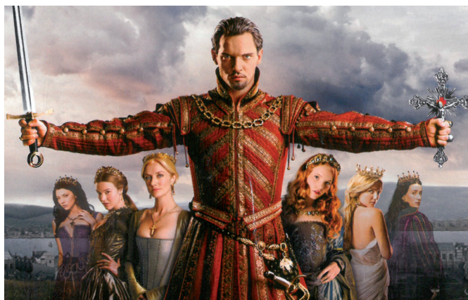
Le glaive et la croix (affiche de la saison 4)

et, en particulier, de l'absolutisme? Dans le fameux frontispice de son ouvrage le plus célèbre, le Léviathan (1651), le corps du monarque est composé de la multitude des corps de ses sujets qui sont passés de l'état de nature à l'état politique en se soumettant au