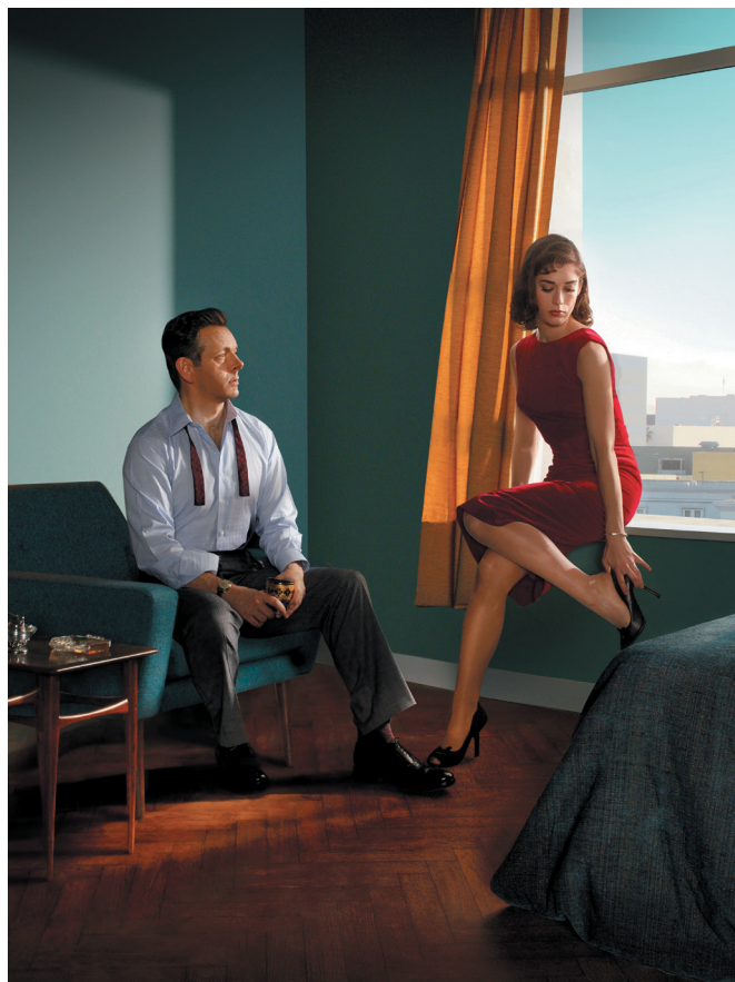
William Masters et Virginia Johnson dans la série

l'industrie culturelle de masse de cet objet insolite qu'est la sexualité humaine et de ce couple étonnant qu'ont formé au laboratoire comme à la ville William Masters et Virginia Johnson n'est pas le moindre des attraits de la fiction. Last but not least , le mythe et la réalité américaine du self made man se trouvent aussi détournés et déclinés au féminin. Il n'est sans doute pas indifférent que l'orgasme féminin soit considéré comme « fait naturel » et fonction