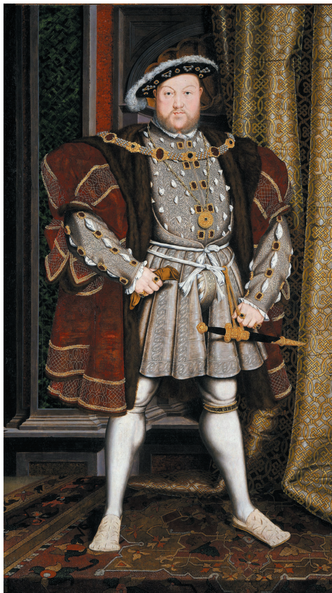
Portrait d'Henri VIII, d'après Hans Holbein le Jeune, vers 1537