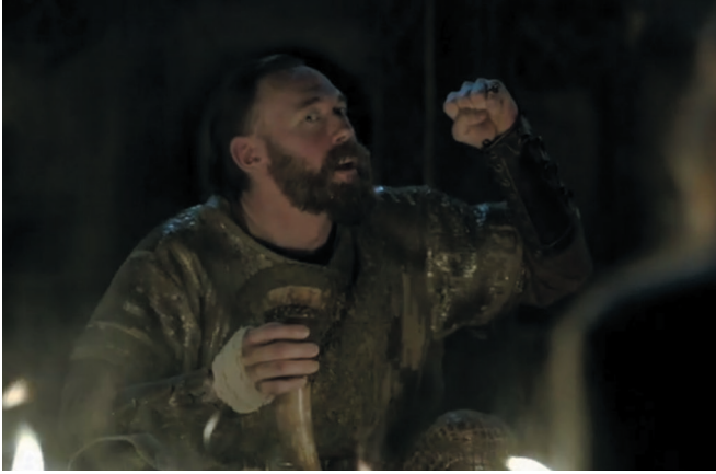
La narration par Harbard du mythe de Thor et Útgarða-Loki (saison 3, épisode 3)

laquelle ce mythe fonctionne comme une leçon sur les champs d'action respectifs des deux grands dieux du Nord, Odin et Thor.