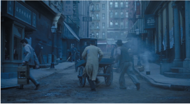
Les rues de New York (saison 1, épisode 1)

est décuplée par une juxtaposition de l'ancien, les modes de faire traditionnels, et le nouveau, la modernité chirurgicale et la technologie. Le thème de la modernité médicale s'impose ainsi à la fois dans sa complexité et sa fragilité : la nouvelle chirurgie repousse les limites du possible, suscite l'espoir chez des malades désespérés, offre de nouvelles opportunités professionnelles et soulève des problèmes inédits sur la sûreté des procédures, la gestion des risques et l'éthique professionnelle.