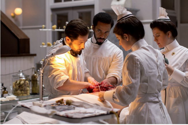
Opérer à mains nues

la stérilisation du matériel chirurgical 14 . La première diffusion des gants dans les équipes opératoires répondait donc à la nécessité de protéger le personnel médical des produits aseptisants et de l'infection de certaines plaies, et non à la stérilisation en soi. Ces premiers gants chirurgicaux étaient noirs, comme en témoigne une photo de 1904 montrant William Halsted en train d'opérer.