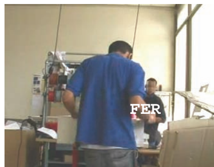
#2: ROD interpelle FER: "mais:: FER/"

L'extrait retranscrit ci-dessus montre une nouvelle fois comment ROD sollicite l'aide de ses collègues de travail pour conduire son activité. En ligne 4, il interpelle son maître d'apprentissage en initiant un échange subordonné préparatoire à une demande: "mais::/ FER/". Mais cette fois également, FER répond de manière non préférentielle à cette intervention initiative ("mais::/ ROD/", l.5). Il reformule ironiquement la demande de ROD en caricaturant ses spécificités prosodiques: l'allongement vocalique sur "mais::" et l'intonation montante accompagnant le prénom de l'interlocuteur. Cet enchaînement non préférentiel n'est pas neutre sur le plan de la conduite de l'interaction. Il marque une forme de désapprobation à l'égard de la requête potentielle de l'apprenant et indique une faible volonté de se mettre à sa disposition. Après un instant d'hésitation, ROD "retire" sa question et propose une clôture de l'échange ("ah non non c'est bon\ c'est bon", l.6), que FER va demander de confirmer ("t'es sûr/", l.7) et que ROD va définitivement valider ("ouais\ ", l.8). On observe donc ici comment se mettent progressivement en place chez ROD des stratégies préparatoires permettant de "sonder" la disponibilité de son maître d'apprentissage. Et on observe également comment l'affichage de l'indisponibilité par FER dans ce registre préparatoire conduit à court-circuiter les échanges en amont des requêtes principales.