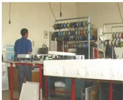
#1: ROD quitte le local informatique pour demander de l'aide: "j'ai un problème il marche pas"