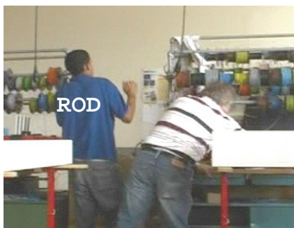
#1: ROD demande de l'aide à FER "je dois effacer et je dois mettre un/"