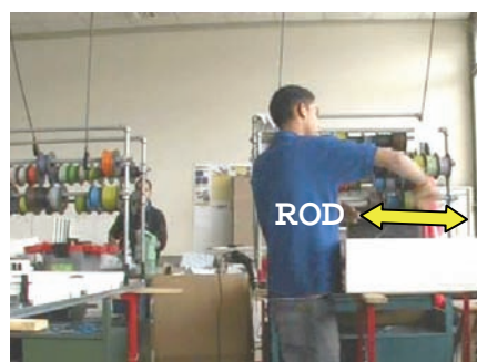
#2: ROD indique la verticalité d'un geste ("vertical comme ça OK")