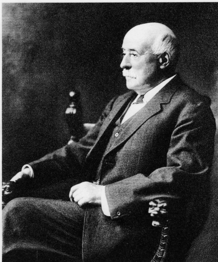
Figure 2. Alexander Agassiz (1835-1910).

Né à Neuchâtel, Alexander Agassiz passe sa première jeunesse dans cette ville. En 1848, il rejoint son père à Boston où il poursuit ses études à la Lawrence Scientific School pour y recevoir une double formation d'ingénieur civil et de biologiste. Grâce aux relations de son père, il est à son tour également engagé par le Coast Survey, mais après une première campagne sur la côte du Pacifique, il donne sa démission, cette activité lui paraissant sans avenir.