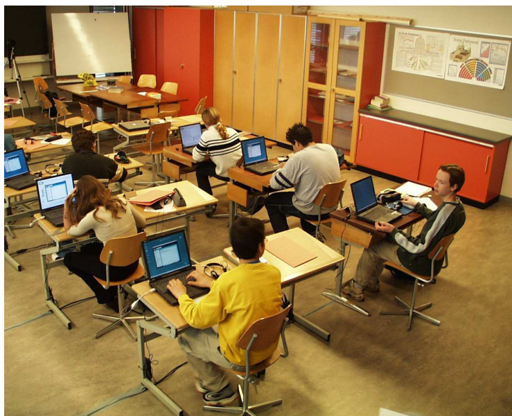
Fig 1. Elèves du Centre secondaire du Bas-Lac d'une classe de 8 ème année secondaire participant au projet SUMUME

Il a été observé à ce propos que, progressivement, les différents partenaires du projet ont développé une plus grande connaissance mutuelle, une capacité d'organisation collective et acquis collectivement un savoir-faire en matière de création pédagogique avec supports multimédias. Ce savoir-faire qu'aucun ne détenait individuellement se trouve à la fois sur le plan technique - conception technologique - sur le plan pédagogique - changement du rôle de l'enseignant, respect du rythme de chacun, suivi plus personnalisé, élèves plus actifs dans leurs apprentissages (figure 1), combinaisons du travail sur ordinateur avec d'autres activités, gain de temps - et sur le plan organisationnel - implications administratives et gestion de l'école.