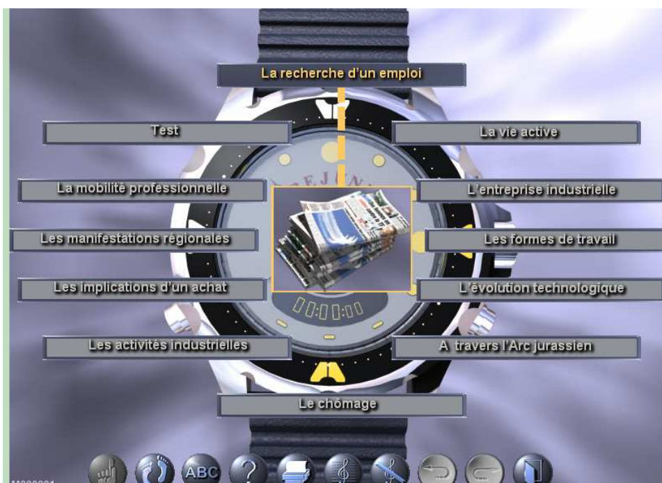
Fig 2. Quelques thèmes à disposition concernant le monde du travail de l'Arc jurassien

Ce projet a mis en évidence des conciliations nécessaires entre l'approche pédagogique des uns et financière des autres. Il a montré également la nécessité de procéder à des réajustements fréquents tant au niveau de la gestion du projet que des choix de médiatisation. Au cours de son développement, on a pu observer la dynamique créative qui naît, localisée en partie au niveau de la coordination du projet, entre les possibilités techniques et les propositions d'activités.