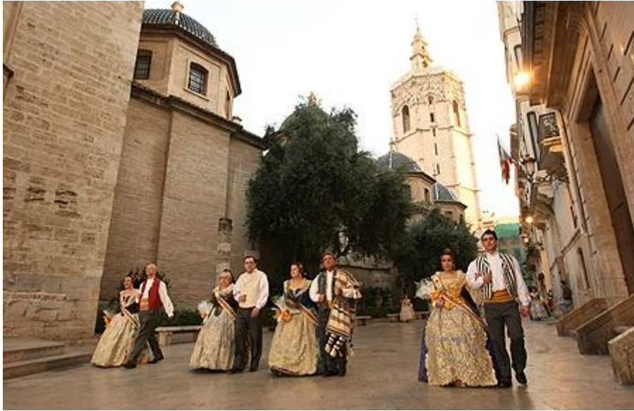
Photo 4 - Défilé des falleros lors de l'offrande de fleurs à la Vierge des Déssemparés, 18 mars 2009. Ils portent les habits « traditionnels ».