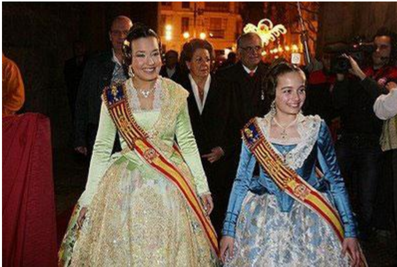
Photo 5 - La Fallera Mayor de Valence 2009 défile avec la fallera mayor enfantine lors de la cridà , le 22 février 2009. A l'arrière plan, la mairesse.

Depuis 1932, un autre personnage est utilisé pour effectuer la propagande de la fête et par extension de la ville : la fallera mayor de Valence. Elle est considérée comme représentante de la fête et des falleros , « la reine des Fallas » 30 . L'origine de ce personnage, incarné chaque année par une jeune fille différente, est attribuée à l'Association Générale Fallera de Valence ou à la Société Valencienne pour le développement et le tourisme, qui y aurait perçu une nouvelle figure de propagande pour la fête (Ariño, 1990 : 345). La fallera mayor est présente à tous les actes officiels aux côtés de la mairesse, mais également dans de nombreux articles de journaux et dans le guide officiel, où quelques pages lui sont consacrées. Elle est toujours accompagnée par douze falleras mayores , qui constituent sa cour d'honneur.