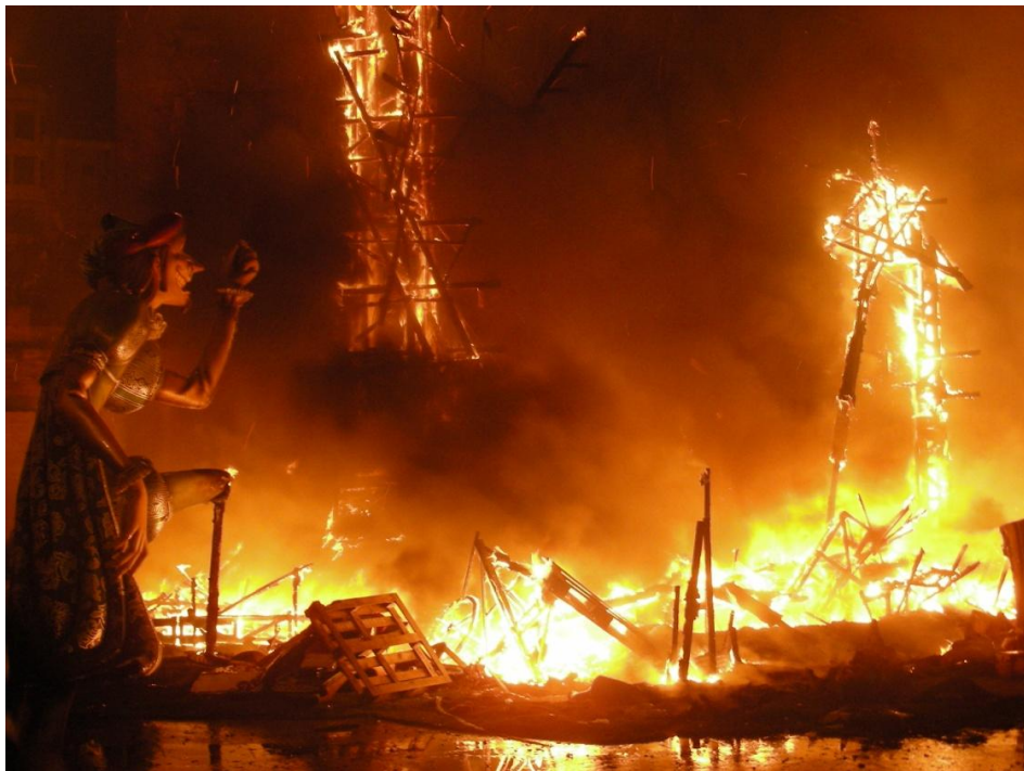
Photo 7 - Cremà Falla del Pilar, 19 mars 2009.