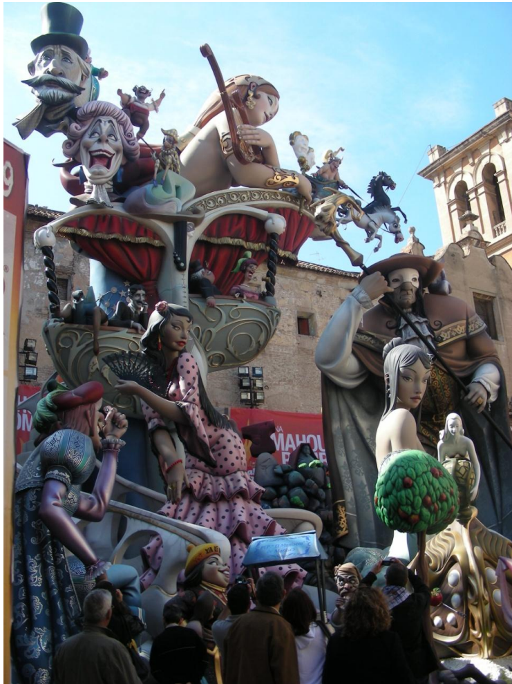
Photo 6 - Falla del Pilar 2009.