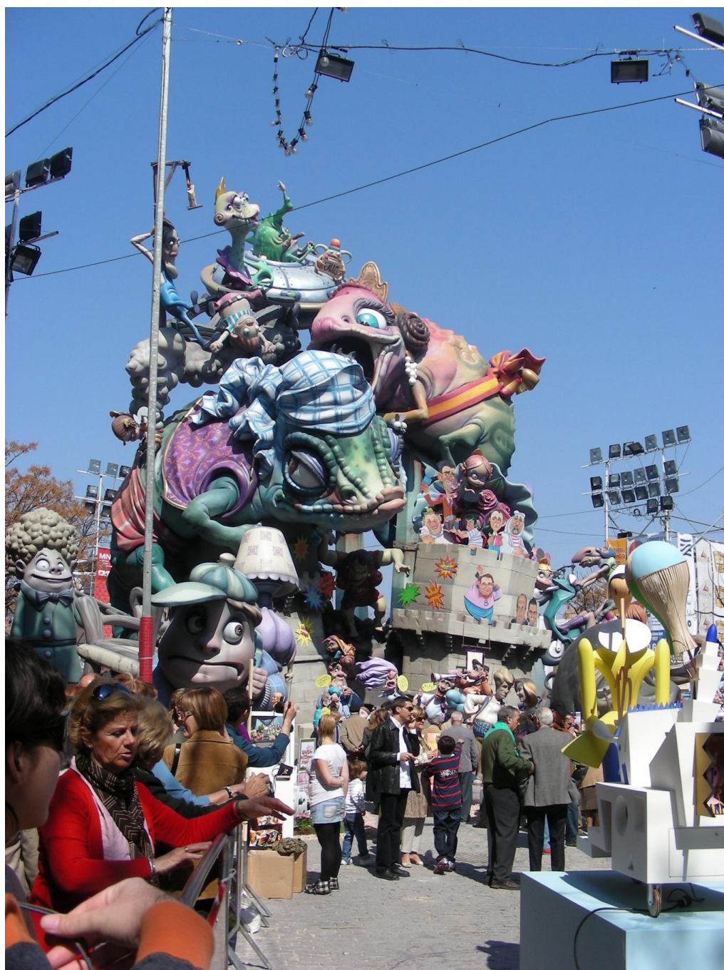
Photo 10 - Falla Na Jordana 2009.

situations imaginaires, des métaphores pour le mettre en scène. Dans un contexte globalisant, Balandier décrit l'imaginaire comme : « l'oxygène sans lequel dépériraient toute vie personnelle et toute vie collective » (1985 : 222). Les artistes tentent ainsi d'apporter un regard neuf sur le quotidien. En 2009, par exemple, la falla Na Jordana représentait deux caméléons, l'un portant les habits de fallero et l'autre de fallera , grimant sur les tours de Serranos. La mairesse figurait debout entre les deux tours, avec la clé de la ville dans la bouche, symbolisant son autorité sur la ville. Le monument faisait référence à la capacité d'adaptation des falleros , « artisans de la fête ».