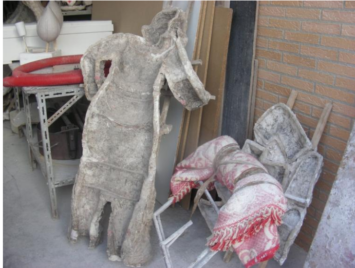
Photo 3 - Moule en plâtre pour produire le ninot d'une falla . Atelier de Raoul et Carmen.

Une structure de bois est incorporée dans une des deux moitiés encore dans le moule. Les deux parties sont ensuite retirées du moule puis jointes à l'aide de colle appliquée sur les bords. Des agrafes sont utilisées pour renforcer la pression et permettre un meilleur ajustement entre les deux moitiés. Une fois la colle séchée, les agrafes sont retirées et les bords sont limés pour enlever toutes les aspérités. Du papier journal est appliqué par-dessus les jointures pour éviter toutes différences de niveau. Avant l'étape finale de la peinture, quatre couches successives d'un mélange appelé gotélé , composé de colle, d'eau et de blanc de Meudon 20 , sont appliquées. Après l'application de la dernière couche, la figure doit encore être poncée à l'aide d'un papier de verre pour obtenir une surface lisse et résistante. Le ninot est enfin prêt à recevoir les différentes couches de couleurs. Tout d'abord, deux couches de peintures plastiques sont appliquées. Ensuite, l'artiste applique les diverses couleurs adéquates à chaque partie de la statue. Le tout est finalement recouvert d'une couche de vernis qui permet d'uniformiser et d'imperméabiliser les couleurs. Actuellement, les artistes continuent d'employer la technique du pinceau, bien que dans certains grands ateliers, les artistes utilisent des pistolets pour accélérer le processus et terminent au pinceau.