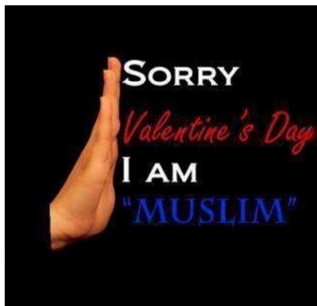
Figure 6 : Anonyme, « Sorry Valentine's Day I am "Muslim". » Montage photographique diffusé sur le réseau social Facebook.