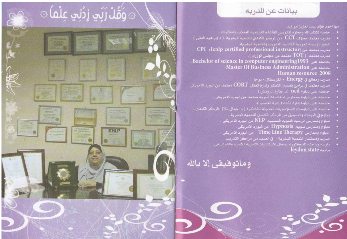
Figure 3 Extrait de la brochure de Maha Ahmad