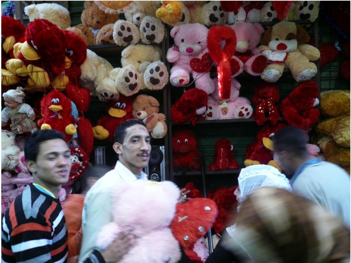
Figure 5 Grossiste en peluches, quartier du Muskī, Le Caire, 13 février 2009