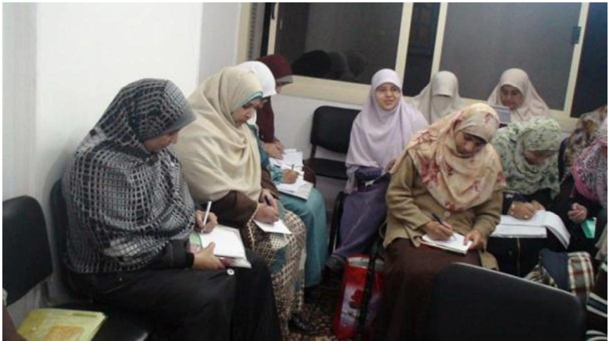
Figure 7 Photographie prise par un membre de l'association Cœur généreux lors de la formation de 2011-2012 de « l'Académie Cœur généreux pour le soutien psychologue aux adolescents » publiée sur l'un de ses sites internet.