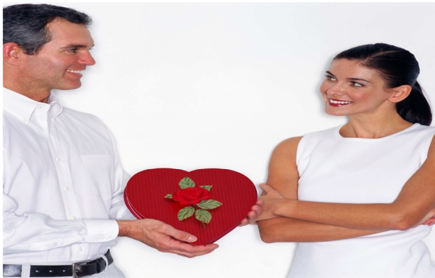
Figure 8 Image accompagnant le texte du power-point de Cœur généreux consacré à l'amour présenté aux écoles.