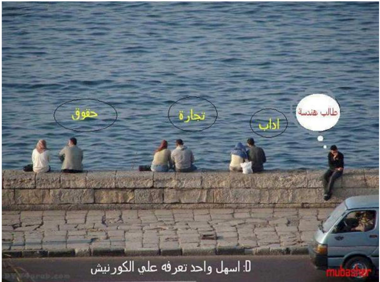
Figure 1 « :D 1 Le plus facile à reconnaître sur la corniche (En jaune, de gauche à droite) Droit. Commerce. Lettres. (En fuchsia.) Etudiant en ingénierie. » Montage photographique anonyme diffusé sur le réseau social Facebook.