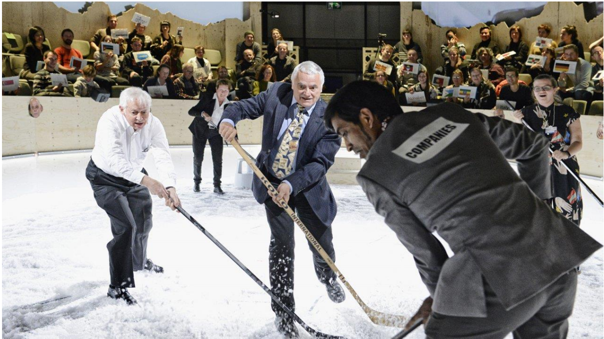
Davos State of the World / Weltzustand Davos (State 4), Rimini Protokoll

Proposition pour le Théâtre Vidy-Lausanne