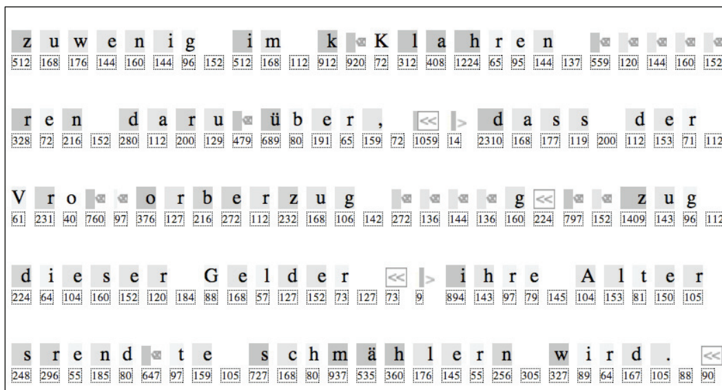
Abb. 2: Auszug aus dem Log-File der Schreibsituation von Proband A: Die Zahlen zeigen die Produktionsdauer des darüberstehenden Buchstabens in ms, für Löschoptionen stehen Löschzeichen, für das Betätigen des Audio-Players Play- / Stopp / Schnellvorlauf-Zeichen. Die Grauschattierungen der Buchstaben deuten die relationalen Produktionszeiten an: je dunkler, desto länger.