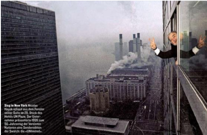
Figure 5 : ANONYME, Nicolas Hayek, New York (1995)