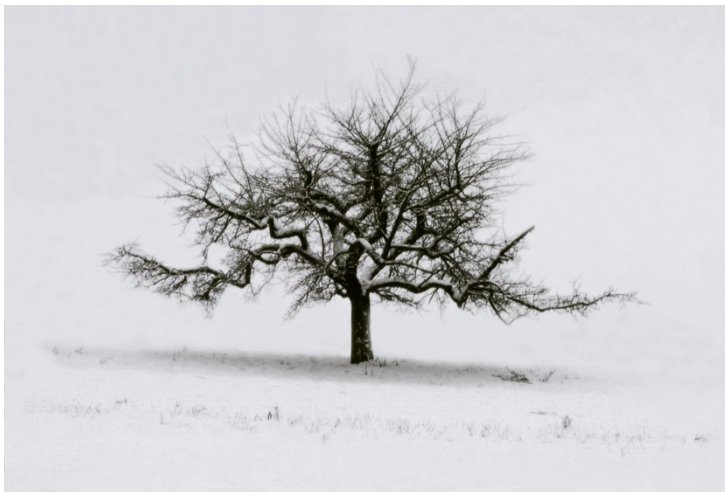
Figure 7 : Frank HORVAT, Apple Tree in Snow, canton de Zurich (1976)