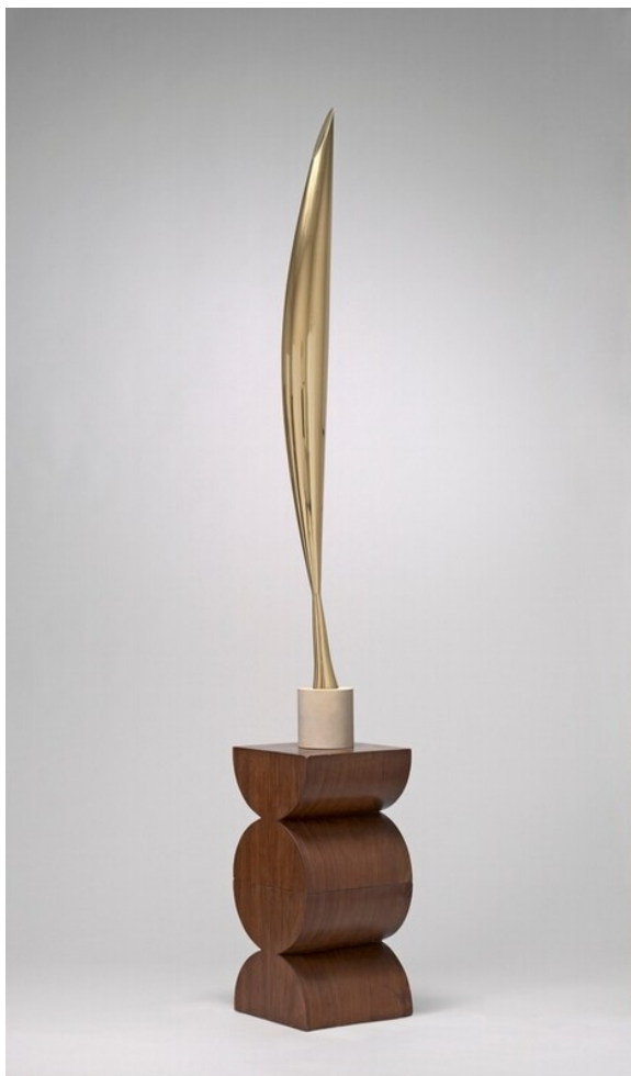
Figure 9 : Constantin BRANCUSI, L'oiseau dans l'espace (1927)