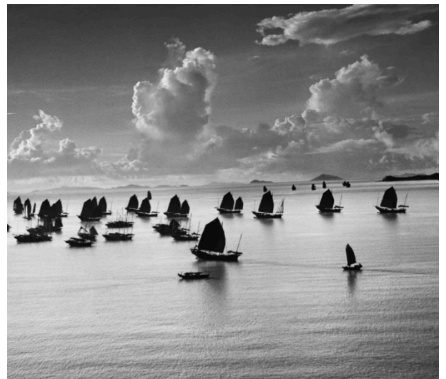
Figure 8 : Werner BISCHOF, Kowloon Harbor, Hong-Kong (1952)