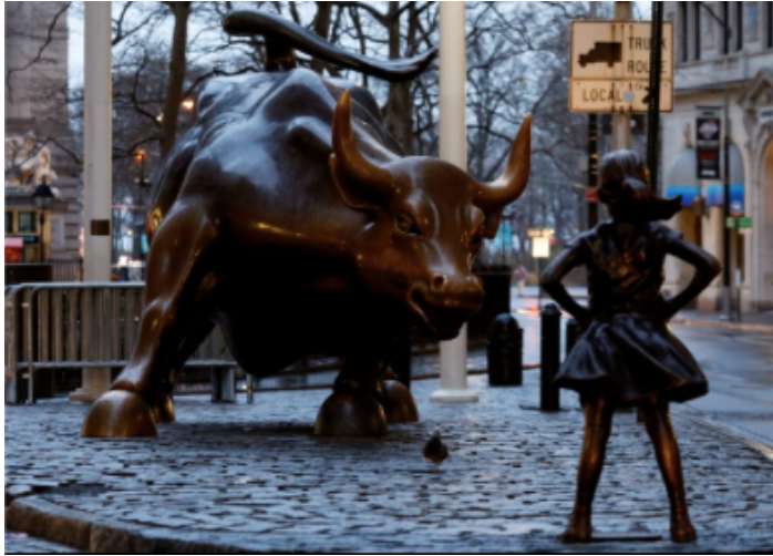
Figure 1 : Le Charging Bull (Arturo DI MODICA) et la Fearless Girl (Kristen VISBAL) (photographie de Brendan McDERMID pour Reuters, 2017).