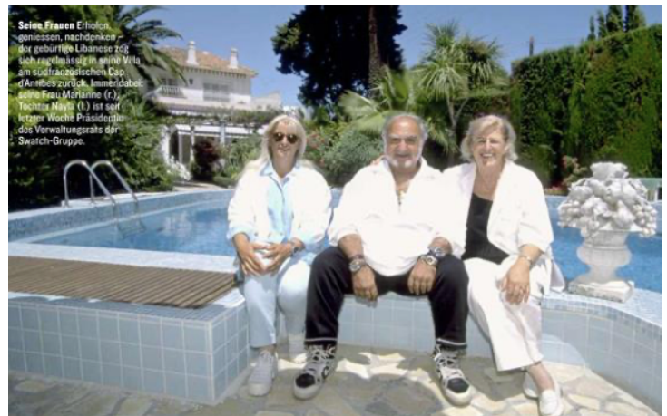
Figure 6 : ANONYME, Nicolas Hayek, son épouse (droite) et leur fille (gauche) (1997)