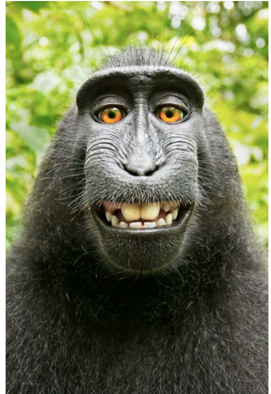
Figure 2 : Macaque Naruto, Sulawesi du Nord, Indonésie (2011)