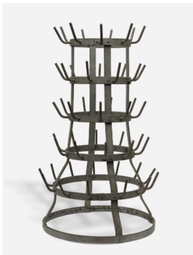
Figure 10 : Marcel DUCHAMP, Porte-bouteilles (1914/1959)