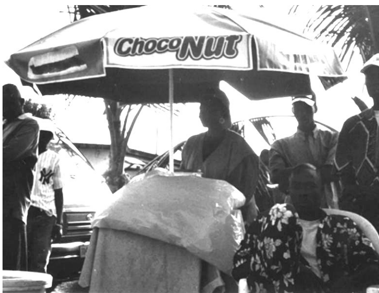
Stand Chocodi vendant des tartines au cacao au tournoi organisé par la FCFFY en 2001 au terrain St.-André de Yopougon