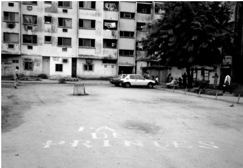
Terrain de « maracana » « Parcs des Princes » à Yopougon

la pratique du « maracana », une sorte de football en miniature qui se joue avec des « petits poteaux » lorsque l'espace à disposition est très réduit ou avec des « grands poteaux » lorsque le quartier dispose d'une surface de jeu plus vaste.