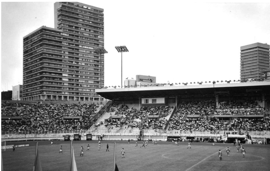
ASEC Mimosas-Al Ahly du Caïre en Ligue des Champions 2001 (R.Poli)

Le phénomène des centres de formation de football en Côte d'Ivoire a pris une importance que nul ne peut ignorer à partir du 7 février 1999, quand les jeunes footballeurs issus de l'Académie Mimos Sifcom 4 liée au club de l'ASEC (Association Sportive des Employés de Commerce) Mimosas, tous âgés de moins de 18 ans, ont remporté à la surprise générale la Supercoupe d'Afrique en battant l'Espérance de Tunis. Jeune Afrique n'avait pas manqué l'événement et titrait « Le triomphe des enfants ». 5