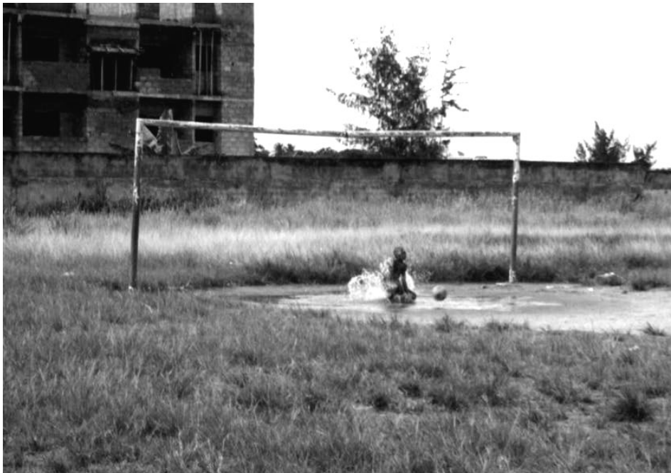
Un enfant « plonge » au Complexe sportif municipal de Yopougon (R.Poli)

Doctorant à l'Institut de géographie (IGG) de l'Université de Neuchâtel et collaborateur scientifique au Centre International d'Etude du Sport (CIES) de Neuchâtel.