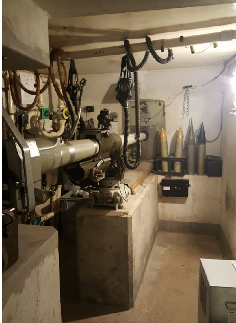
Panzerabwehrkanone und massives Geschütz.