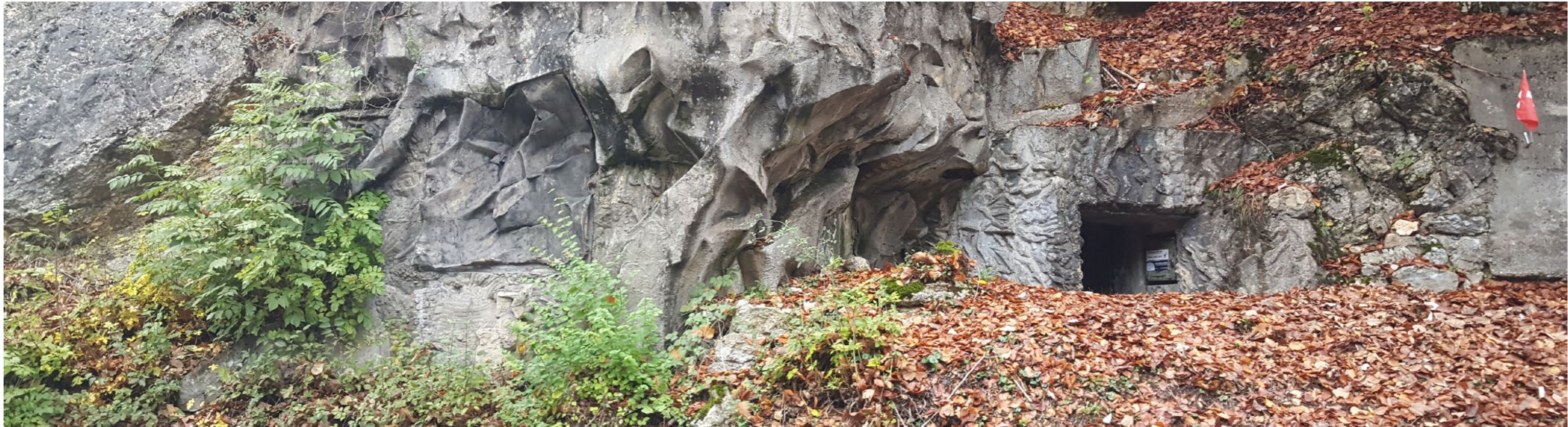
Bunkereingang und falsches Gestein.

Dabei sind Bunker auch in einem übertragenen Sinne klimatechnische Leistungen, das heisst atmosphärische Raumschöpfungen auf einer psychisch-affektiven Ebene. Es geht um die Produktion eines Klimas der Solidarität, einer schützenden Blase der geteilten Hoffnung, aber auch des geteilten Schicksals, in der die Versammelten kraft ihres Zusammenseins selbst raumbildend wirken. Heute noch ist eine ganz spezielle Atmosphäre im Bunker Valangin spürbar. Wobei diese eher nostalgisch als martialisch wirkt. Zu museal sind die feinsäuberlich aufgereihten Gewehre im Eingangskorridor, die Tassen mit Schweizerkreuz in der Vitrine, die Funkzentrale samt Brustbild des General Guisan. Hier werden nicht nur Objekte, sondern auch Gefühle, Ansichten und Vorstellungen konserviert, irgendwo zwischen Mythos und Relikt, Kameraderie und Kampf, Vergangenheit und Gegenwart. Es sind auch diese Ambivalenzen und Spannungen, die die Stimmung im Bunker ausmachen.