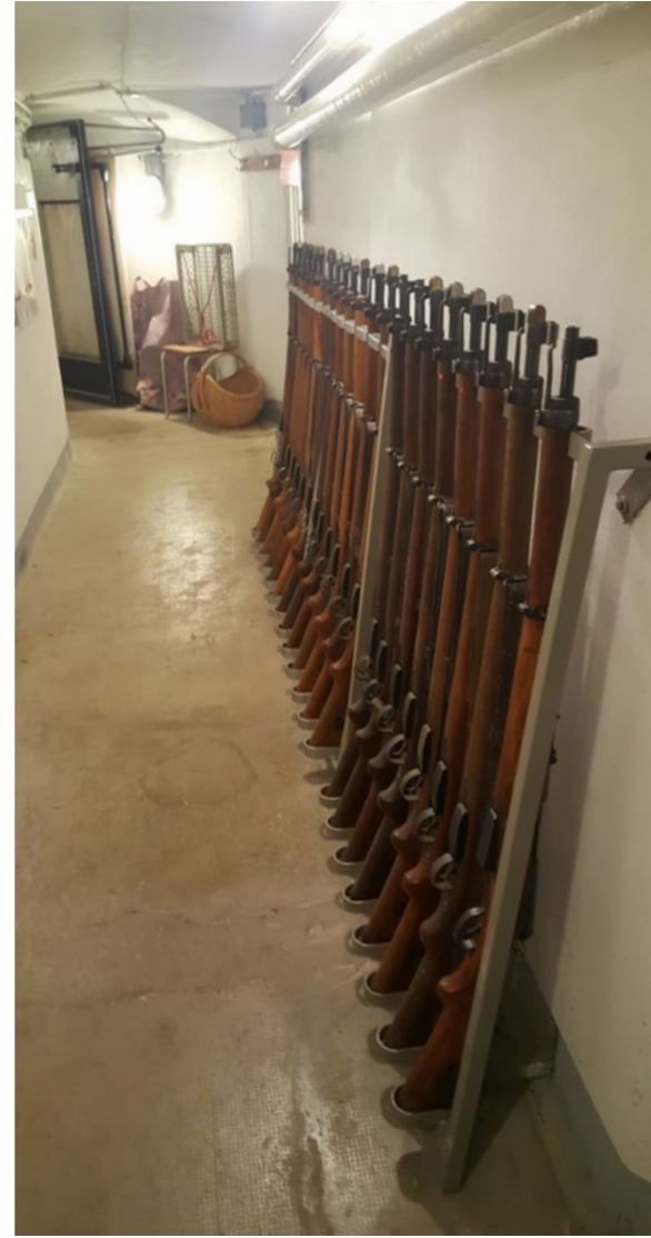
Eingangskorridor mit Gewehren, in Reih und Glied.