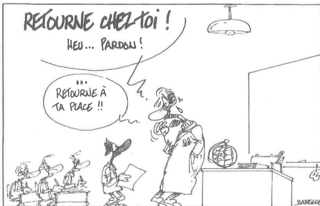
dessin de Barrigüe, paru dans l'Éducateur n° 13, octobre 94

"Les nouveaux arrivants doivent abandonner le plus vite possible les caractéristiques culturelles qui les distinguent de la société d'accueil et se fondre dans cette société où ils deviennent des citoyens comme les autres, avec les mêmes droits et les mêmes devoirs" (Ouellet, 1988, pp.36-7).