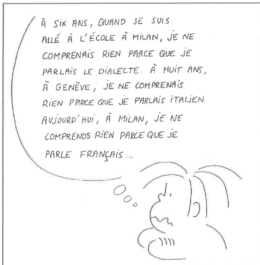
"Emigration", dessin de Tonucci (1985, p.54)

C'est ce dernier élément que nous allons aborder maintenant