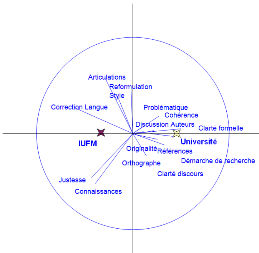
Fig 2: Dimensions évaluatives attribuées aux enseignants par les étudiants sur l'écrit qu'ils jugent emblématique de leur discipline

Les dimensions évaluatives que les étudiants attribuent aux correcteurs de leur écrit emblématique font apparaître un contraste entre les types de formation: l'exigence de références bibliographiques, par exemple, est absente pour les PE, mais présente chez les historiens et les littéraires de l'université.