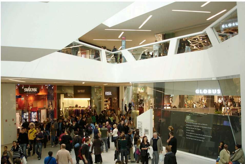
Bild 3: Das Einkaufszentrum Westside am Eröffnungstag, Oktober 2008

gen, dass die Bedeutung eines Ortes umstritten ist. Wie Knox und Marston hervorheben, kann der Charakter und die Bedeutung eines Ortes von verschiedenen sozialen Gruppen unterschiedlich wahrgenommen werden, insbesondere je nachdem, ob es sich dabei um insiders (Leute aus dem Ort) oder outsiders (Leute von aussen) handelt. Diesen Gruppen stehen unterschiedliche Möglichkeiten zur Verfügung beim Zugang, Erleben und Gestalten dieser Räume. Daher muss die Untersuchung von bestehenden Machtverhältnissen bei Fragen bezüglich des "Ort machens" ( place making ) und der Bedeutungsaufladung von Räumen im Zentrum stehen.