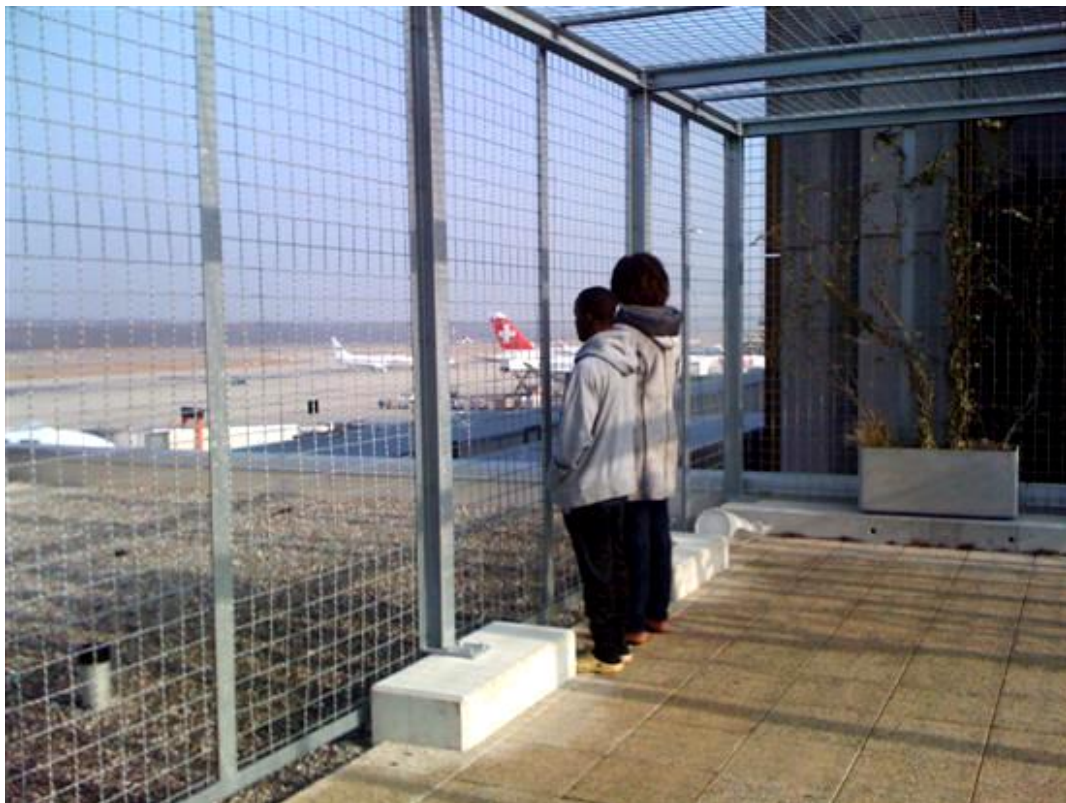
«La volière»