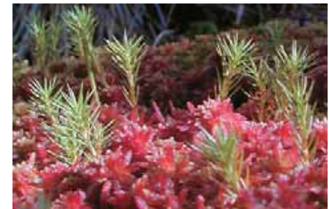
Die Moose Polytrichum strictum und Sphagnum rubellum (rot)

Bei der Regeneration von Torfmooren stellen sich zunächst Pionierpflanzen ein, die den Boden kolonisieren. Sobald sie einmal Fuss gefasst haben, fördern sie die Ansiedlung und das Wachstum von Torfmoosen (Grosvernier et al. 1995). Die globalen Veränderungen wie Klimawandel, Stickstoffeintrag und erhöhte CO 2 -