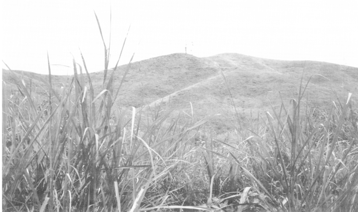
Photo 2 – L'herbe américaine empêche toujours la régénération du couvert végétal sur ces collines bordant la route Nha Trang – Ban Me Thuôt ; cet axe était considéré comme stratégique lors de la deuxième guerre d'Indochine (Juillet 1998).

La politique de regroupement stratégique et d'urbanisation forcée mise sur pied par les Américains a aggravé la distribution inégale de la population et gonflé les villes du Sud où finissent par se concentrer 10 des 19 millions de Sud-Vietnamiens. De plus, le Vietnam est aux prises avec une croissance démographique exponentielle (+ 2,7%/an). Afin de décongestionner les deltas et de pallier leur morcellement parcellaire, Hanoi décide de procéder à un vaste redéploiement de la force de travail sur l'ensemble du territoire et de défricher de nouvelles terres. Les hauts plateaux, relativement peu peuplés, sont destinés à recevoir des centaines de milliers de colons. C'est là que sont créées la plupart des Nouvelles Zones Economiques (NZE) favorisant l'implantation de colons dans une région où la population est encore en majorité non kinh. Les informations à ce sujet sont imprécises. Il semble toutefois qu'au cours des 20 dernières années, à l'échelle de l'ensemble du pays, au moins trois millions de colons ont été déplacés vers les NZE. (...) Ainsi, entre 1976 et 1990, le terroir agricole est passé de 4,3 à 6,9 millions d'hectares, soit une croissance de 60 % largement supérieure à celle de la population (De Koninck et al., 1996 : 394). Le gouvernement est submergé par une population qui double en moins de 30 ans. Celle-ci a besoin de place et bouscule les premiers habitants du pays vers les terres les moins fertiles.