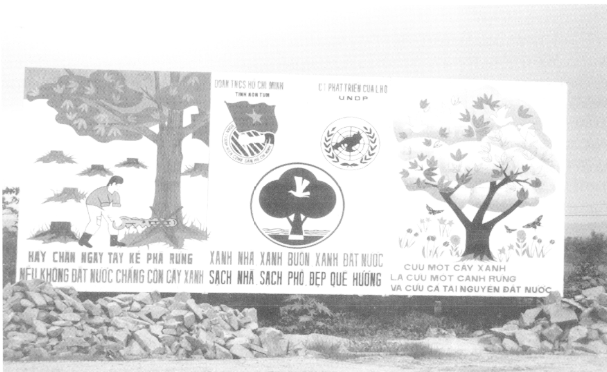
Photo 4 – Prenant conscience des effets négatifs de la déforestation, le gouvernement vietnamien a lancé des campagnes de sensibilisation mettant en exergue le rôle vital de la forêt, comme en témoigne ce panneau situé à l'entrée de la ville de Kontum (Août 1998)

Afin de limiter les impacts de la déforestation, le gouvernement tente de réagir par l'entremise de programmes de reboisement et d'une gestion axée sur une économie forestière durable. Peut-être le Vietnam, après avoir surexploité son capital boisé et faute de pouvoir renoncer à l'utilisation de ces ressources, reconnaîtra-t-il le savoir-faire traditionnel des "gardiens de la forêt" qui ont réussi à tirer le meilleur parti de la forêt tropicale. La nécessité de recréer le couvert forestier pourraient servir de point de départ à l'effort en vue de sauver les premiers habitants des hauts plateaux. C'est dans cette orientation que se situe l'action de Nouvelle Planète. En mettant sur pied, en collaboration avec des responsables locaux, des pépinières-écoles à Kontum et Pleiku, l'objectif de cette ONG est non seulement de favoriser le reboisement mais également de développer un secteur proche des connaissances des Montagnards et de les former à des méthodes de culture susceptibles de remplacer la technique du brûlis. Parallèlement, la création de pépinières villageoises permet aux Montagnards de reboiser leur environnement direct.