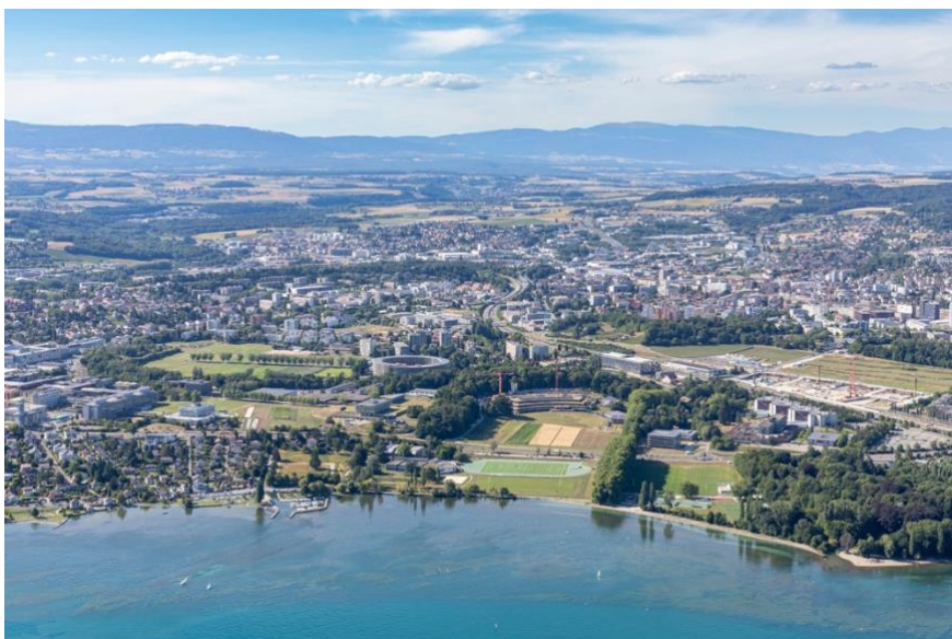
Image 1: Le campus vu du ciel, juillet 2022.

Mémoire de master soumis pour l'obtention du diplôme de Master of Arts en Conservation de la biodiversité