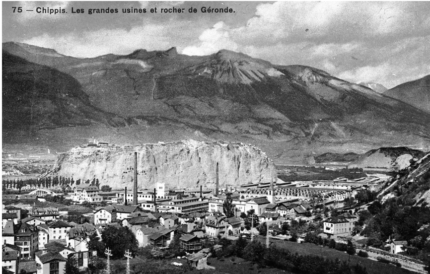
Fig. 1: Carte postale représentant les usines d'aluminium de Chippis dans les années 1910–1920. On distingue l'Institut pour enfants sourds et muets sur la gauche de la colline de Gérondo. La carte postale a été affranchie en 1930.