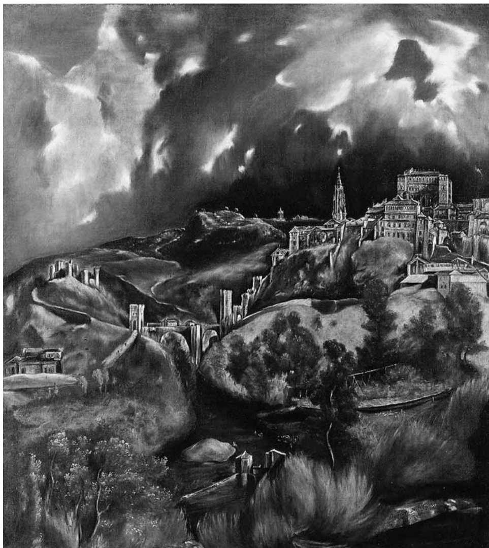
El Greco, Vista de Toledo (1596–1600)

También en la historia de Nuestra Señora que trahe la casulla de San Ildefonso para su ornato y hacer las figuras grandes me he valido en cierta manera de ser cuerpos celestiales como vemos en las luces que vistas de lexos por pequeñas que sean nos parecen grandes. (Cossío 1965: 236–37)