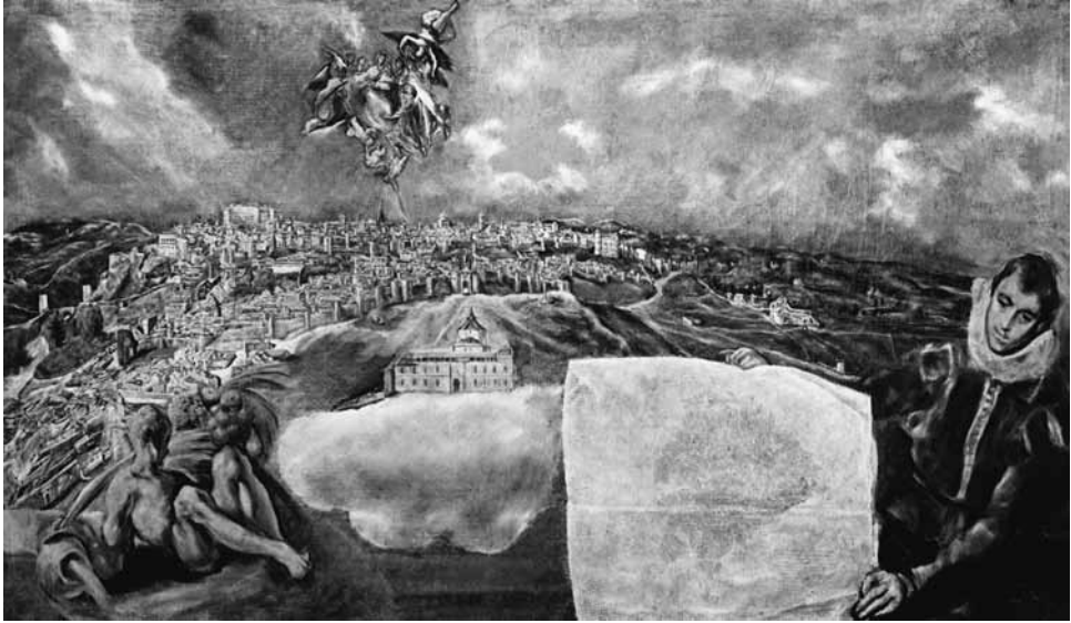
El Greco, Plano y vista de Toledo (c. 1608)

Esta pintura tan original es obra del artista más innovador del Toledo áureo, El Greco, un pintor a quien sus contemporáneos califican artística y personalmente de ‘singular’ (Pacheco 2001: 483) o, en palabras del artista aragonés Jusepe Martínez, 5 de pintor ‘de extravagante condición’ (Cossío 1965: 43). El Greco es un artista tan especial que comentaristas tradicionalistas como el pintor y teórico dieciochesco Antonio Palomino de Castro y Velasco le reprochan que ‘llegó a hacer despreciable y ridícula su pintura, así en lo descoyuntado del dibujo como en lo desabrido del color’ (Cossío 1965: 246). 6 El cuadro en concreto es el tal vez inacabado (Jordan 1982: 256) Plano y vista de Toledo , que reproducimos a continuación.