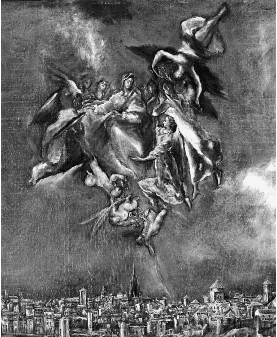
Plano y vista de Toledo , El Greco (c. 1608), detalle

soneto de Lope destaca por la gravedad y corporeidad con que describe las figuras celestes, que tenemos la impresión de ver suspendidas del cielo. Las dos primeras palabras del soneto, 'cuelgan' y 'racimos', son las que producen esta sensación de pesantez de los ángeles, una sensación a la vez voluminosa y etérea que resulta muy original y distintiva del poema. El grupo de la Virgen y los ángeles del cuadro del Greco provoca una impresión idéntica de que 'the entire group is plunging downward' (Pita Andrade 1969: 130). Julián Gállego ya destacó el 'insólito ángel cabeza abajo' (1972: 216) en el coro angélico, y si examinamos la escena con