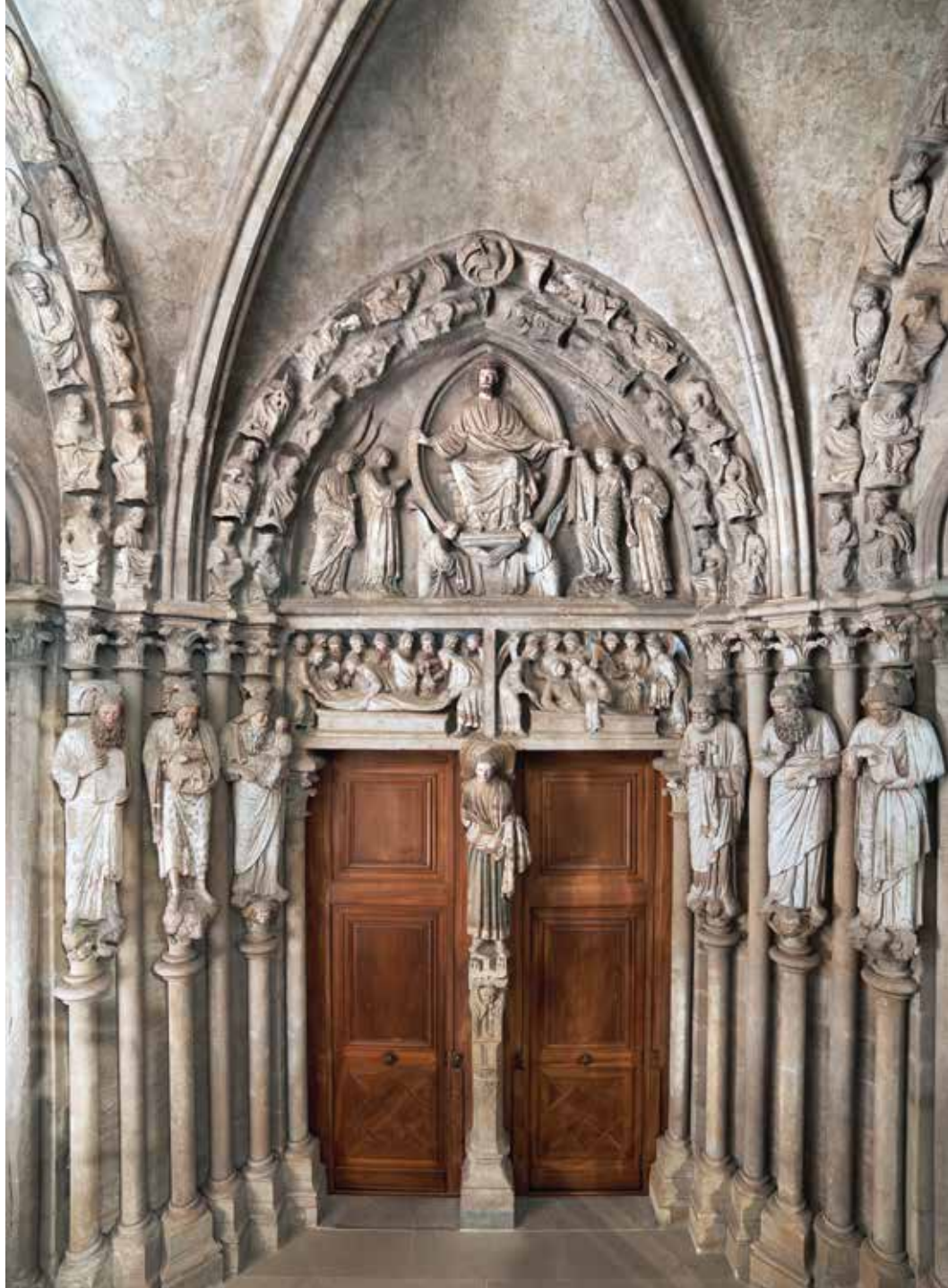
Portail peint de Lausanne.

Les analyses du portail de Tui suggèrent une période de construction entre 1216 et 1235. C'est un contemporain de celui de Lausanne. Ce portail aurait été construit en remplacement d'un précédent, et son décor intègre les innovations architecturales et plastiques développées quelques années auparavant en France, notamment à Chartres. Les parentés entre les deux portails soulèvent des questions passionnantes : pourraient-elles révéler une connexion jusqu'ici insoupçonnée entre ces sites ? À propos de Tui, les historiennes et les historiens de l'art espagnols ont eux aussi noté des parallèles avec les cathédrales de Laon, Senlis et Chartres, souvent convoquées pour Lausanne. Ces ressemblances résultent-elles d'un lieu de formation commun, Chartres, par exemple, ou d'un déplacement d'artisans entre les deux sites ? Un sculpteur ayant travaillé d'abord à Lausanne, formé peut-être par le maître-sculpteur responsable de l'édification et du décor du porche aurait-il reçu la commande du portail de Tui ? Bien