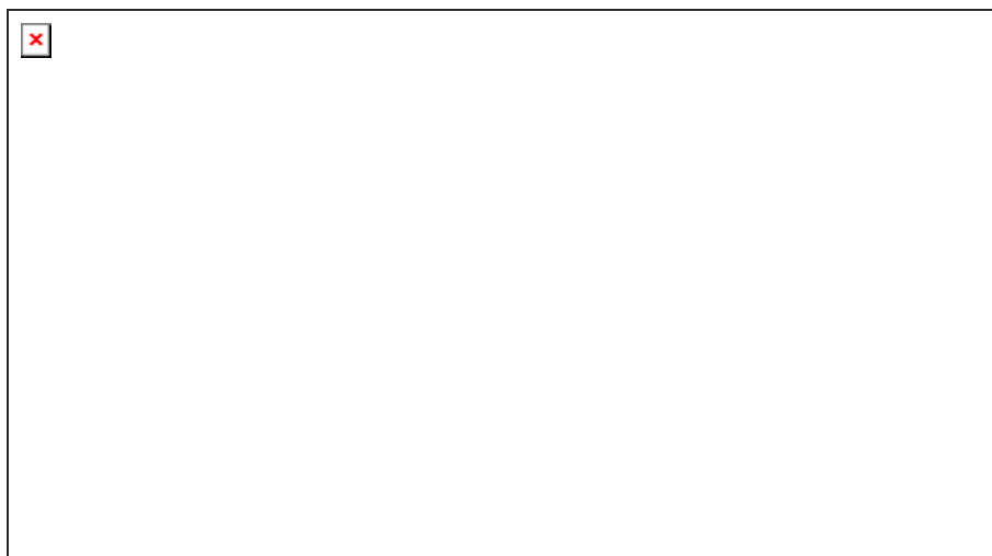
Carte 5 : La structure du système sportif mondial

Le cœur du système est représenté par les pays de la « triade » (Amérique du Nord, grands pays de l'Europe de l'Ouest et Japon) et l'Australie. La taille de leur population est assez vaste pour pouvoir dégager des champions. Ils possèdent une véritable tradition sportive parfois plus que centenaire dans certains sports. Leur système sportif a les moyens de former les entraîneurs, de mettre en place un système de détection précoce, de développer un encadrement médical de premier plan, d'offrir les meilleures conditions d'entraînement (équipements, etc.). Enfin, ils ont l'argent nécessaire au développement d'une activité de sport spectacle télévisé, base de la rémunération des sportifs. Les résultats de ces pays aux différentes grandes compétitions internationales traduisent l'excellence de ces systèmes sportifs. Dès lors, leur marché du travail exerce une formidable attraction sur les athlètes des pays « périphériques », ce qui se traduit par des flux importants en direction de ces pays et aboutit pour d'autres raisons évoqués plus haut à des naturalisations. A côté de ce cœur, on observe plusieurs périphéries d'où viennent la grande majorité des sportifs naturalisés.