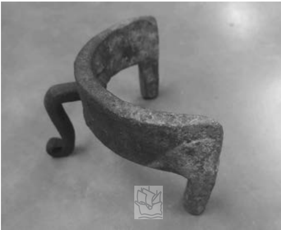
Figure 2. Cale-pot, France, XIX e siècle (Maison Rouge - Musée des vallées cévenoles, Alès Agglomération)