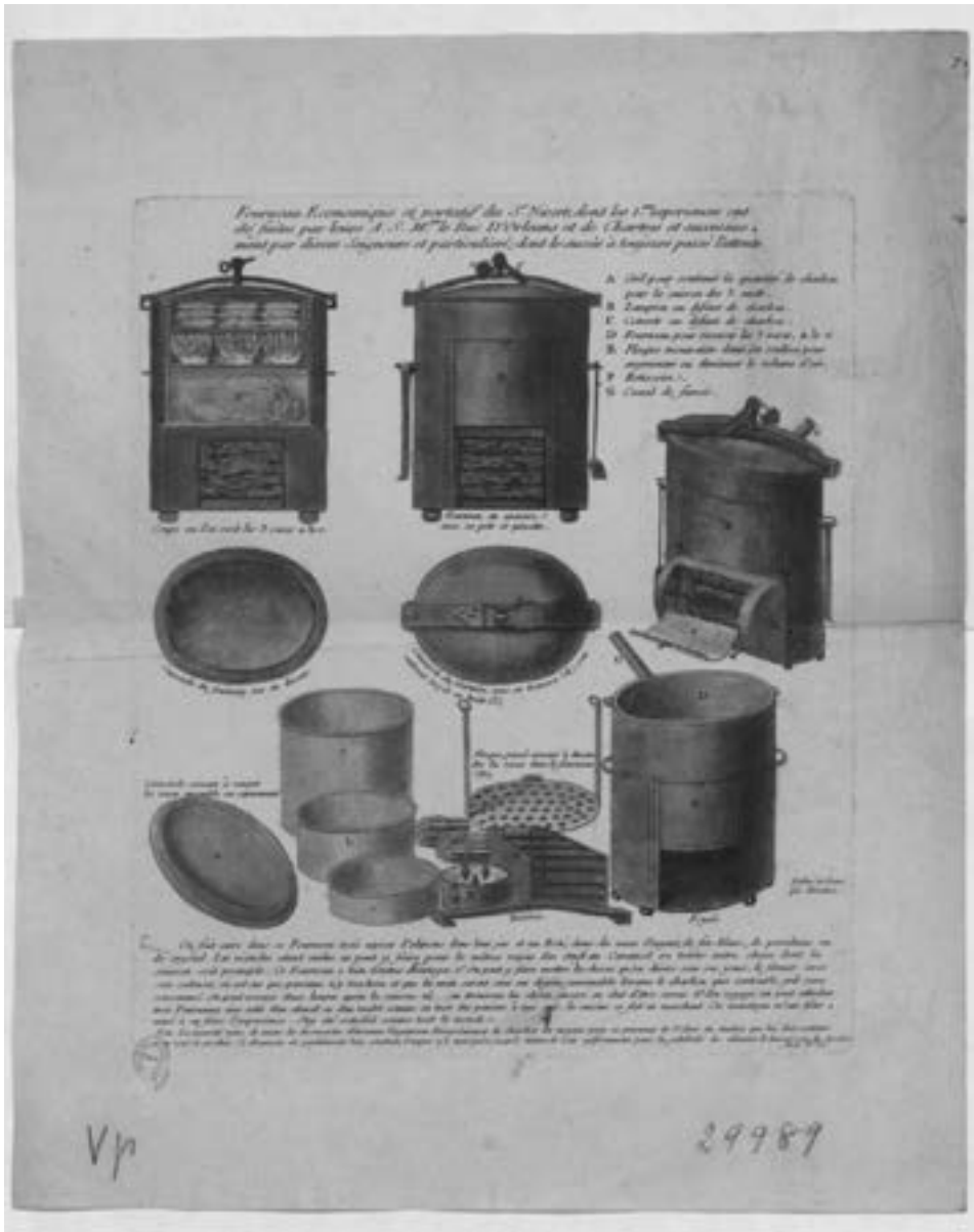
Figure 3. Nouveaux fourneaux économiques et portatifs, extrait de la Gazette de santé, du dimanche 1er octobre 1780, n° 40 (BNF, département Littérature et art, VP-29989).

diriger la chaleur, avec la multiplication des fonctions des foyers. Dans ces machines, l’usage du charbon coexiste avec celui du bois, même s’il tend à s’imposer peu à peu au cours de la deuxième moitié du siècle. Ces micro-inventions montrent que l’amélioration des “techniques du feu” n’est pas l’apanage des savants mais est l’enjeu d’un savoir pratique lié à la connaissance des matériaux – spécialement des métaux –,