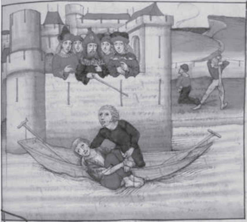
Fig. 4. L'exécution du bâtard Vauthier par décapitation et de l'un de ses complices par noyade, DIEBOLD SCHILLING, Spiezer Chronik, 1484-1485, BERNE, Bibliothèque de la Bourgeoisie, Mss.h.h.I.16, p. 557 (version en couleurs p. 557).