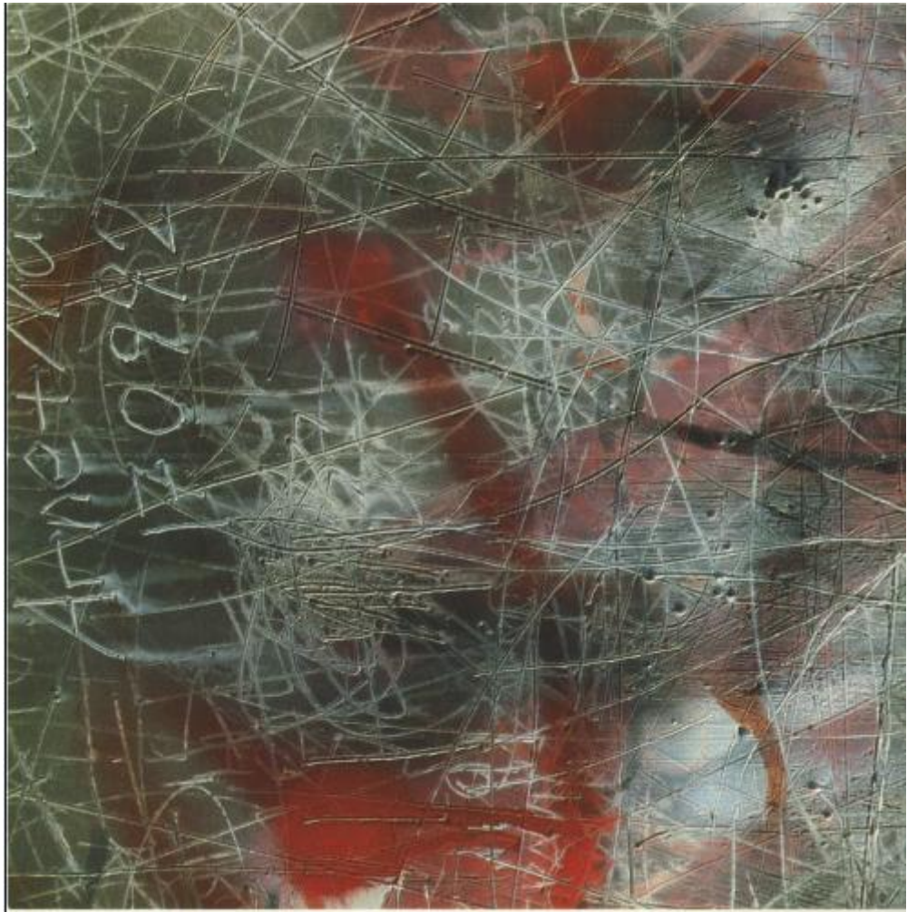
Figure 11