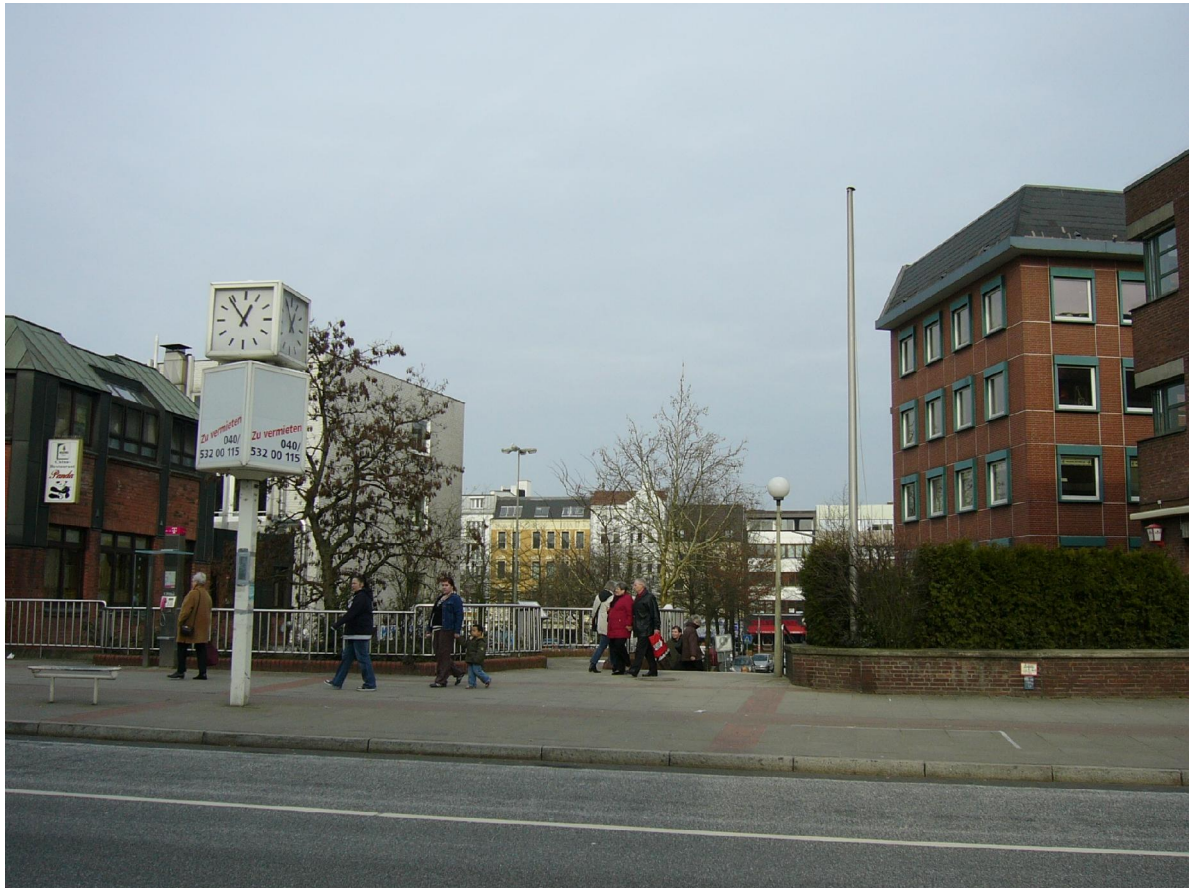
Figure 3 © 2007, Julie Perrin