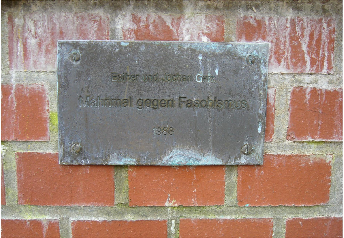
Figure 5 © 2007, Julie Perrin