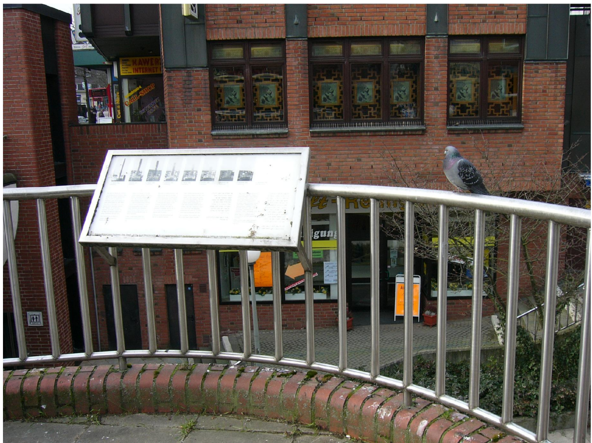
Figure 4 © 2007, Julie Perrin