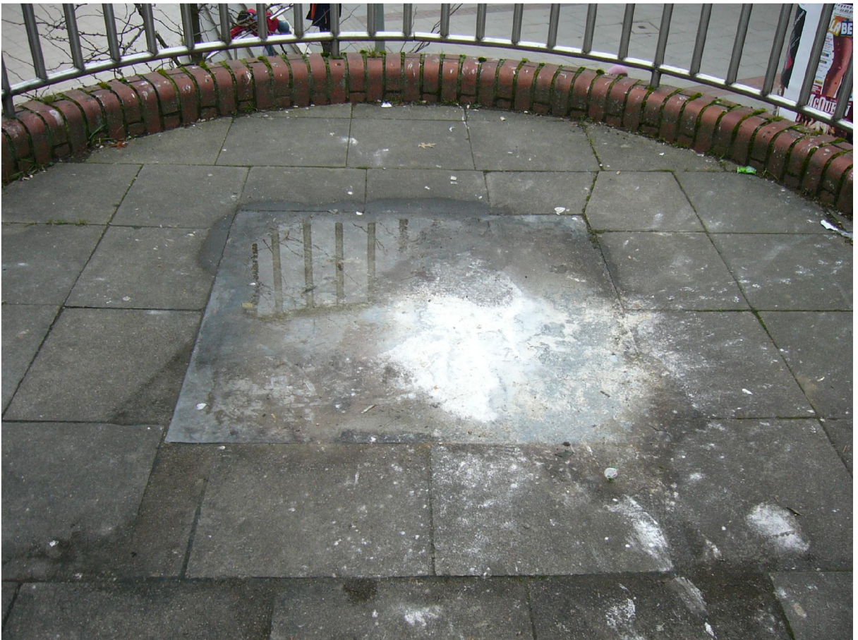
Figure 6