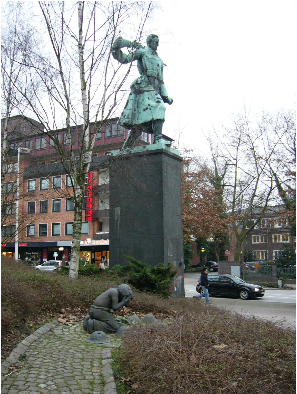
Figure 12