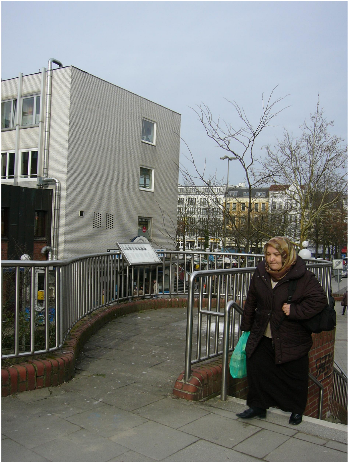
Figure 7