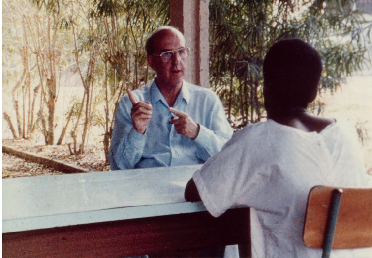
Les visites au Centre spirituel de Bonamoussadi, à Douala en 1992.

reparlera plus tard de cette période en la qualifiant de « très fatigante » mais en reconnaissant l'intérêt de tous ces contacts.