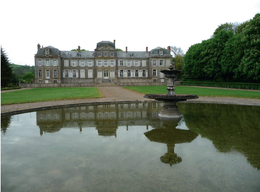
Les jardins du château.