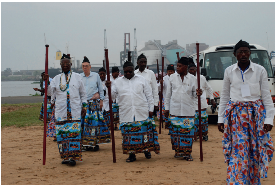
Les Patriarches à la fête du Ngondo en 2010.