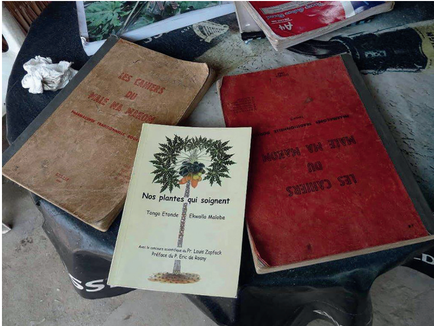
Les Cahiers du Male ma makom .