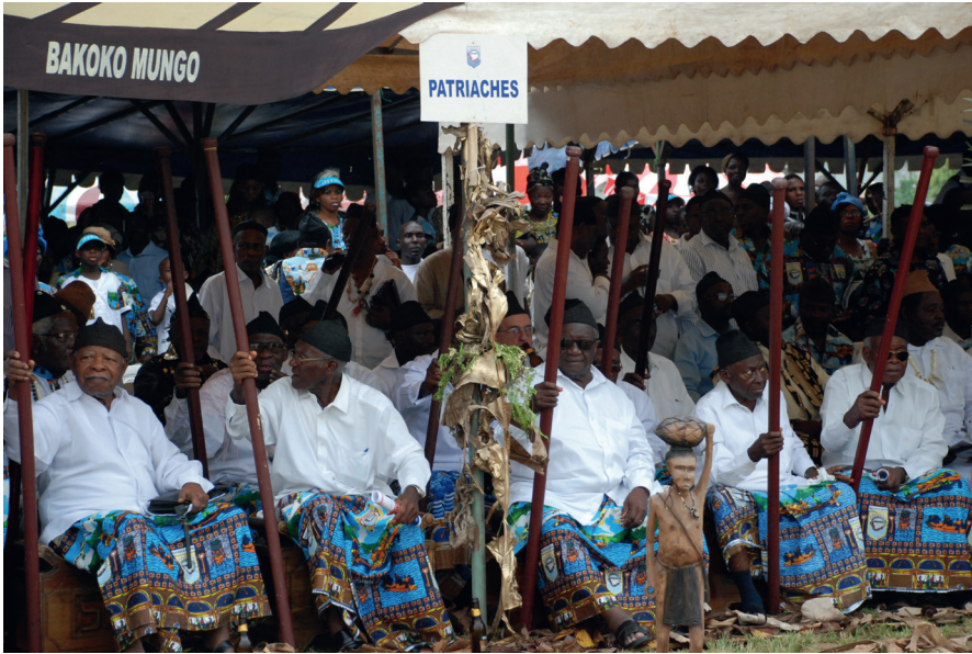
Les Patriarches à la fête du Ngondo en 2010.