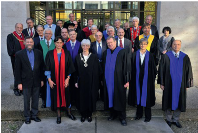
Le cortège des autorités et des quatre docteurs honoris causa de l'Université de Neuchâtel lors du Dies. La Rectrice Martine Rahier est au centre, Éric de Rosny derrière elle.