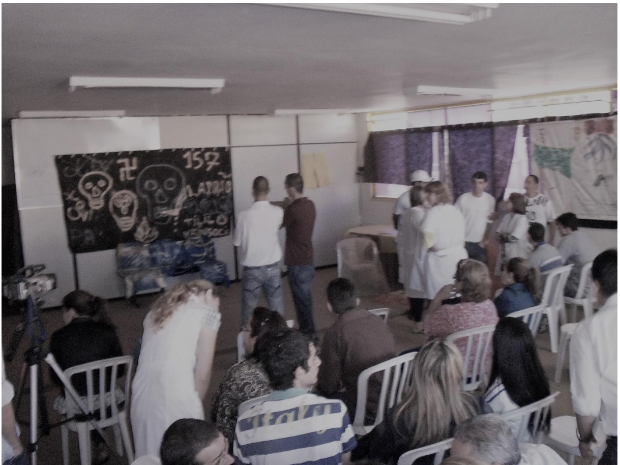
Photographie tirée dans le jour de la représentation du spectacle.

Le théâtre de l'opprimé en tant qu'outil pour favoriser la réintégration sociale des détenus : un dialogue entre la criminologie critique, la psychologie historico-culturelle et la pédagogie critique.