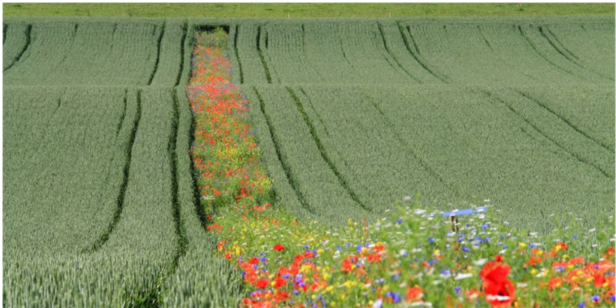
Image 1 - Bandes fleuries

Source : UFA Revue (2019). Site internet