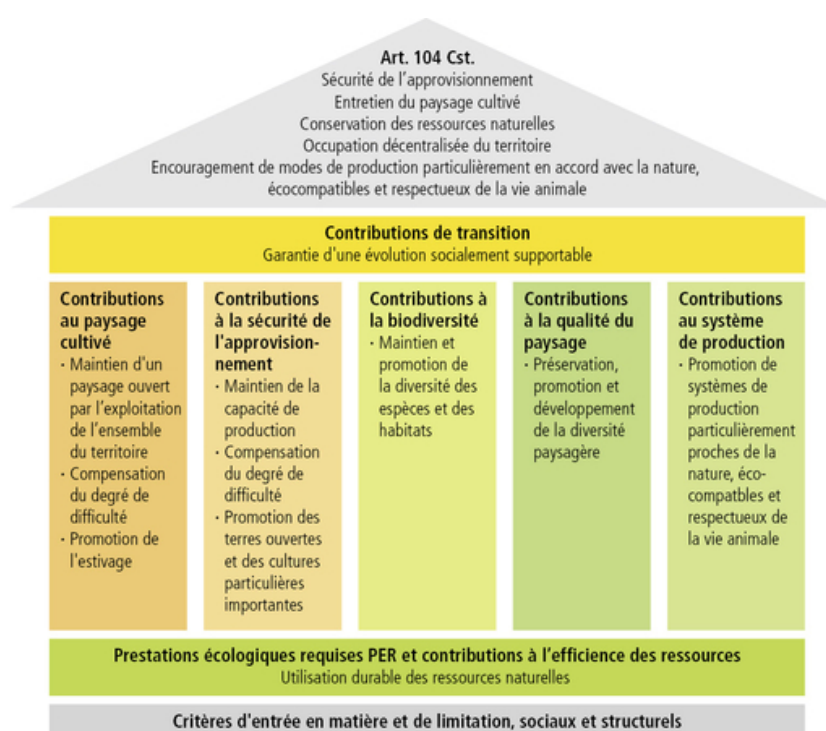
Figure 2 - Représentation schématique des paiements directs