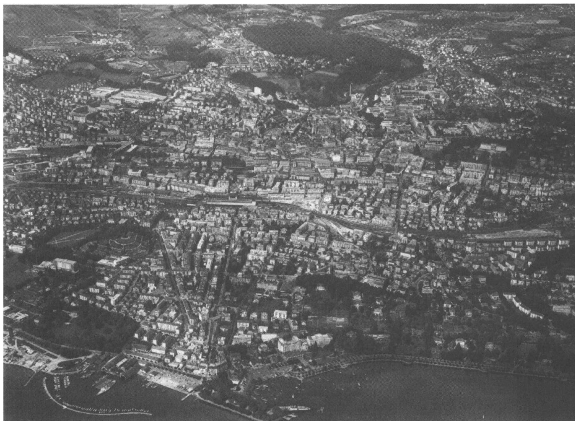
Fig. 2: L'urbanisation croissante des rives du Léman amène à l'étude des premières stations d'épuration des eaux dans les années d'après-guerre. La Ville de Lausanne lance des travaux préliminaires en 1948 mais n'inaugurera la station de Vidy qu'en 1968.