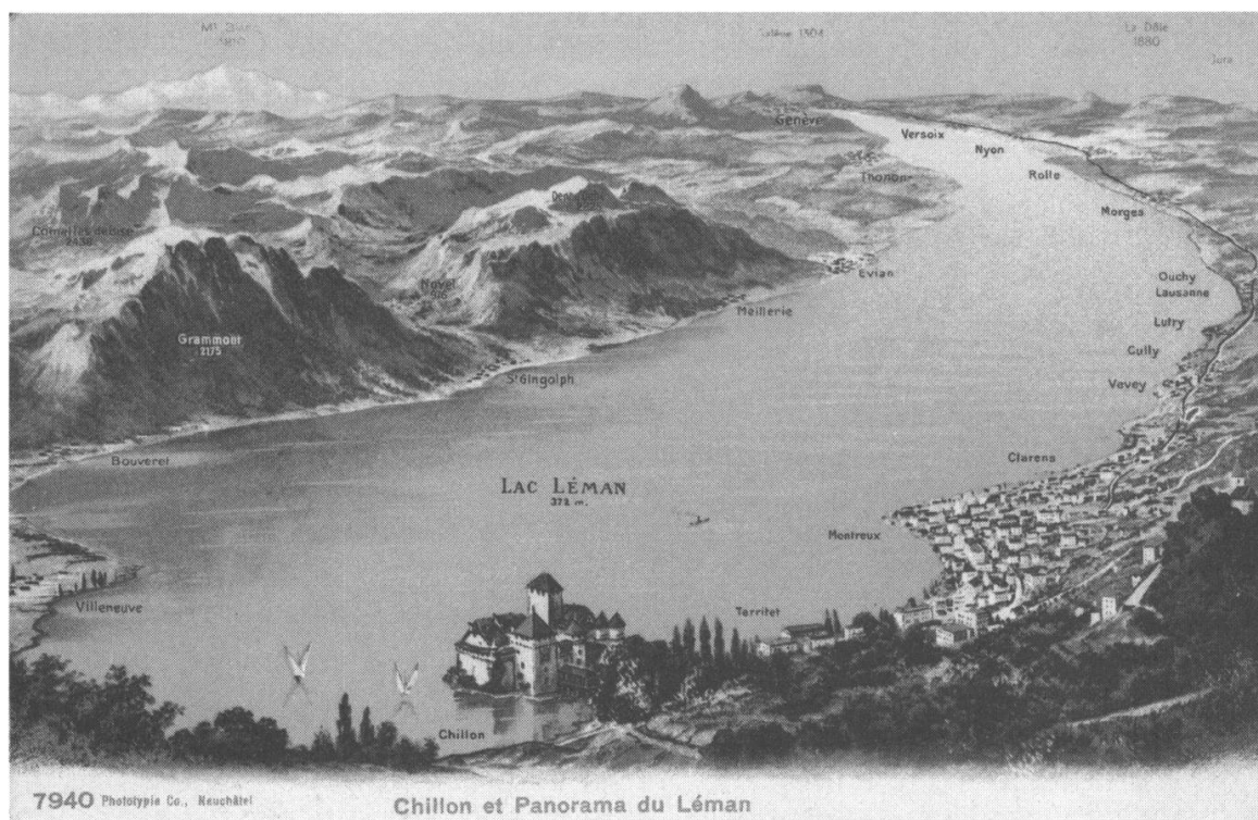
Fig. 1: Le tourisme de la région lémanique se construit notamment sur l'image d'une eau pure dans un cadre alpin. Ici, une carte postale datant des années 1910.

l'assainissement des eaux résiduaires. 5 En outre, la production relative à la question des pollutions industrielles est désormais bien établie, en témoigne un récent ouvrage de synthèse mondiale. 6 Quant aux sources mobilisées, elles sont constituées avant tout par les fonds du Service fédéral de la pêche, puis des eaux déposés aux Archives fédérales suisses, par les nombreux rapports publiés par la CIPEL ainsi que par la littérature spécialisée traitant de ces questions, tel le Bulletin de l'Association romande pour la protection des eaux et de l'air . 7