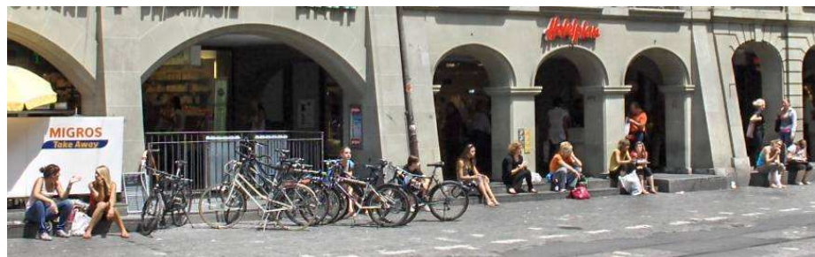
Illustration 2 Le Phénomène d'agencement de séjour est aussi observable sur les arcades de la Spitalgasse à midi

Face à l'ampleur que prend le phénomène de consommation de repas et boissons à l'emporter dans les espaces publics, cette étude propose une analyse fine des pratiques de séjour