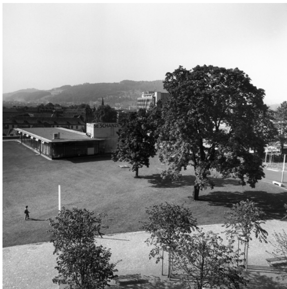
Illustration 8 (Kloetzli & Friedli , 2000)