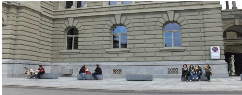
Illustration 3 Pique niqueurs sur les bancs devant le Palais Fédéral

du point de vue, certes, des aménagements spatiaux (mobilier urbain, végétation, revêtement) mais aussi du cadre matériel relativement figé (topographie, environnement bâti, vues) et des facteurs sociaux. La démarche choisie est empirique. Elle s'ancre de façon pragmatique dans la