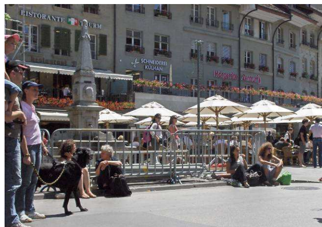
Illustration29 Détournement de barrières de manifestation pour le séjour de midi, WP