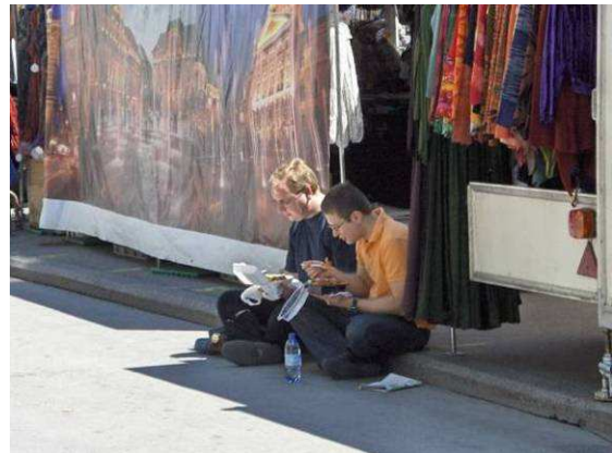
Illustration 25 Détournement de la bordure de trottoir entre les stands du marché, WP

Toujours concernant le choix du secteur pour le séjour de midi, je supposais que la forte fréquentation de certains aménagements lors des pauses de midi s'explique par la liberté d'appropriation et de détournement qu'ils procurent. Je vais présenter dans ce chapitre les informations récoltées auprès des acteurs quant aux secteurs qu'ils privilégient. Les observations de détournement d'usage seront en dernier lieu présentées dans le chapitre suivant. J'ai donc demandé aux acteurs où ils préfèrent s'installer sur la place/ le parc où ils se trouvaient et pour quelles raisons (question n°8). Plusieurs fois, ils me répondent de façon triviale qu'ils se trouvent là où ils sont, car c'est tout simplement par là qu'ils sont arrivés sur la place ou dans le parc, et que le lieu de travail ou d'étude vers lequel ils se rendent ensuite en est proche. J'ai donc constaté, comme pour le choix entre différents espaces publics où séjourner, que la proximité joue un rôle majeur dans le choix d'un aménagement de séjour au sein même d'une place ou d'un parc.