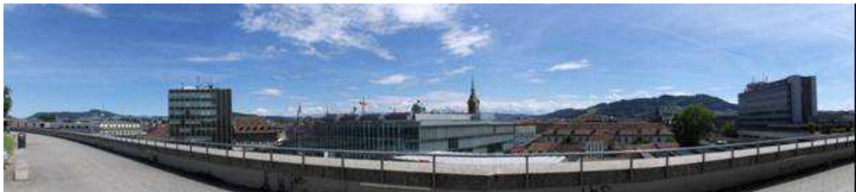
Illustration 4 Panorama de la GS ( F. Eitel, 07.2008)

Sur le plan morphologique, les deux terrains retenus pour l'étude ont en commun d'être situés à l'emplacement des anciens fossés ( Graben ) qui bordaient les murs extérieurs de la ville. Le parc de la Grosse Schanze tout d'abord (ou Parkterasse ) est un ancien retranchement de la ville. Il est situé à l'extrémité de la vieille ville médiévale, entre les quartiers gare, Brückenfeld , Stadtbach et le quartier de la Länggasse , qui accueille la majorité des bâtiments de l'université. La terrasse artificielle qui recouvre les voies CFF est donc à proximité immédiate de la gare centrale de Berne.