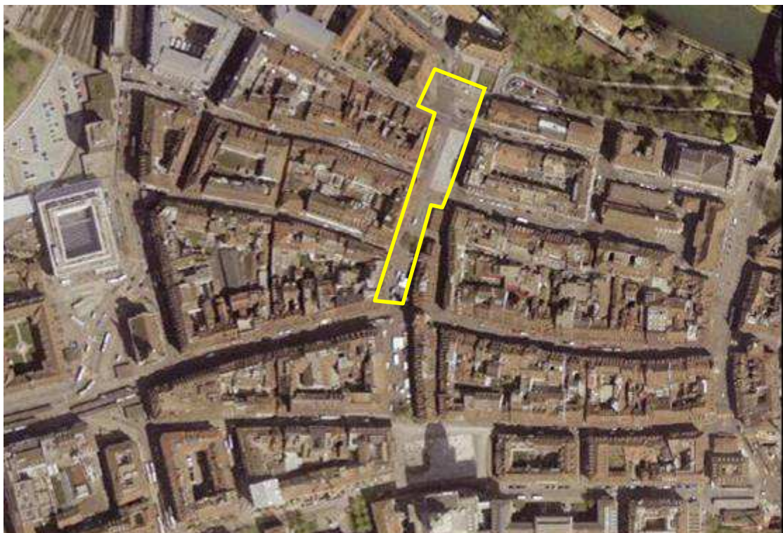
Illustration9 (www.stadtplan.bern.ch, 2004)

En termes d'accessibilité, la place est très bien reliée aux différents réseaux de mobilité. Située dans une zone piétonne, elle bénéficie d'une dizaine d'accès piétonniers. L'arrêt Bärenplatz est desservi par cinq lignes de bus, et un deuxième arrêt est situé un peu plus à l'ouest. La place demeure accessible aux taxis et livreurs ainsi qu'aux vélos. Une douzaine de places de stationnement à leur intention (généralement non équipées) sont réparties dans le périmètre. Enfin, un parking pour les voitures est situé au nord, proche du poste de police. L'étude « Nutzungskonzept » (concept d'usage) du bureau d'architectes EHRENBOLD et SCHUDEL (2007) atteste la fréquentation très élevée de la place, qui atteint même la saturation aux heures de pointe sur sa partie supérieure, c'est-à-dire au carrefour de la Spital- et de la Marktgasse (voir carte des flux Waisenhausplatz en annexe). Enfin, deux parcours balisés ( Wege zu Klee et Einstein Weg ) traversent la place, au nord.