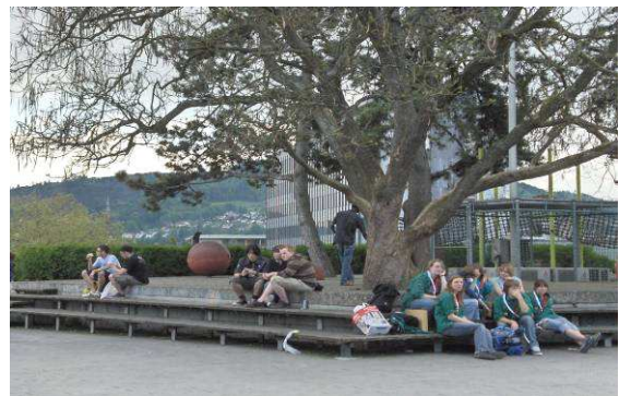
Illustration 28 Les marches en bois des la place de jeux, très appréciées pour le séjour GS