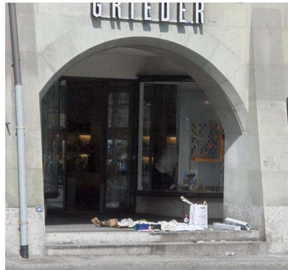
Illustration21 Un jour où le ramassage des déchets était volontairement annulé de 8:00 à 13:30 pour un reportage TV, WP