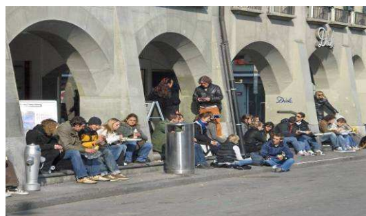
Illustration 1 Pause de midi de février, WP (JL 02. 2008)

Les cas particuliers de deux espaces publics très fréquentés à midi sont à l'origine de cette recherche. Le constat initial d'un rassemblement de foule urbaine dans certains espaces publics à midi soulève l'interrogation suivante: pourquoi certains espaces sont-ils fréquentés plus que d'autres? Quels facteurs, liés au cadre matériel, à l'aménagement spatial ou aux composantes sociales expliquent l'adéquation de ces espaces aux modes de vie contemporains et plus particulièrement aux pratiques de séjour? La question des agencements des espaces publics sera traitée relativement aux pratiques de séjour spécifique aux temps de pause de midi.