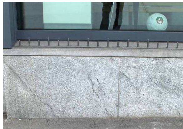
Illustration15 Une stratégie privée pour empêcher le séjour, WP, (02.05.2008)