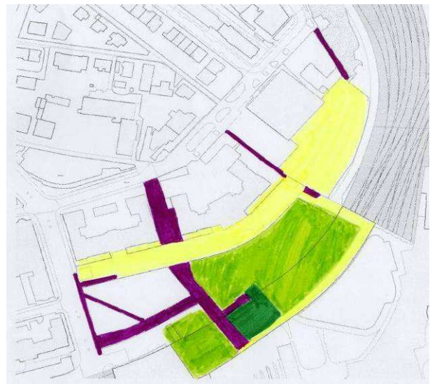
Illustration13 Fonction de séjour et de passage de la GS ( JL)

voionitairement maintenue non praticable afin de marquer le statut d'espace public de la Plateforme par rapport à la route à fort trafic qui la borde.