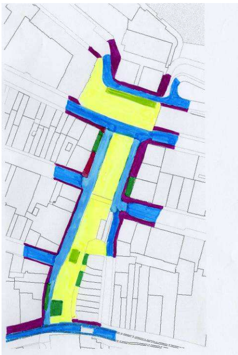
Illustration12 Fonction de séjour et de passage WP (JL)

Tandis que la pelouse ( Liegewiese ) et la place avec la fontaine et la place de jeux sur l'esplanade en bois sont clairement dévolus au séjour, la promenade bordée de tilleuls devant les bâtiments de même que la promenade sur le pourtour sud-est du parc et l'Einstein Terrasse devant le bâtiment des Science exactes ont pour fonction de relier la Schanzenstrasse aux bâtiments, aux espaces de séjour extérieurs, aux accès à la gare et au parking ou à l'autre extrémité du quartier. Le seul espace de consommation payante est le restaurant Grosse Schanze et sa terrasse. La forêt paysagée qui borde la Schanzenstrasse est