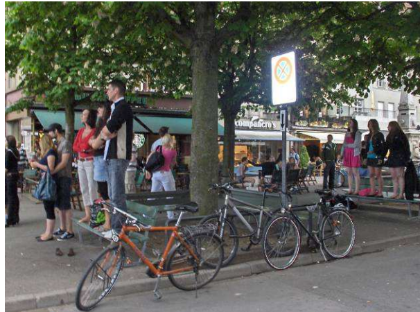
Illustration23 Détournement de bancs comme gradin pour la représentation qui a lieu sur la gauche de l'image, WP

Les passages suivants, extraits des paroles recueillies auprès des usagers, confirment eux aussi cette première hypothèse. Voici quelques extrait de réponse à la question « Où préférez-vous vous installer sur cette place et pourquoi? » (n°8): « Dort kann man alles sehen, man kann beobachten » (n°35) « Um d'Lüt aluege » (n°33) ou encore: « il y a foule, il y a des gens » (n°37). Les jeunes qui s'assoient quotidiennement sur le bas de la place m'expliquent d'ailleurs qu'ils apprécient y séjourner pour regarder les gens. Il faut spécifier que cette place bénéficie de l'animation d'une place de centre ville: artistes de rues en tous genre (musiciens, danseurs, jongleurs, médium), passages de personnes au style de vie marginal ou à l'apparence excentrique (punk, mendiant) comme j'ai pu le constater lors de mes heures de présences sur le