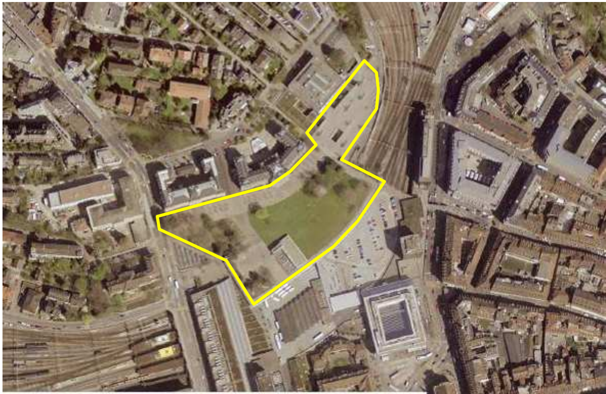
Illustration 5 Vue aérienne de la GS ( www.stadtplan.bern.ch , 2004)