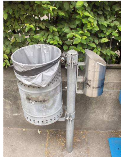
Illustration22 Cendrier à la Längasstr. (JL 06.2008)