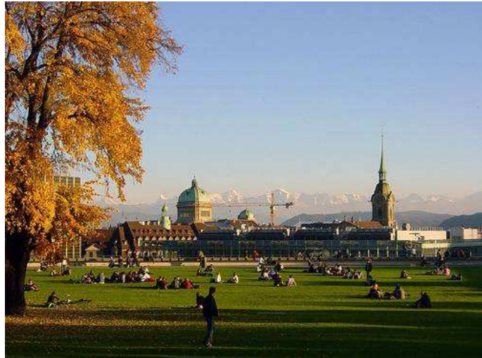
Illustration 6 Vue sur le Palais Fédéral et la cathédrale,GS ( http://farm1.static.flickr.com , 10.2005)

La Grosse Schanze est un espace piétonnier. Il n'y a pas de transit de véhicules, mis à part les livreurs et services d'entretien. Trois arrêts de bus et de cars postaux sont situés à moins de cinq minutes de la Plateforme, en plus de la gare principale. De nombreux parcs à vélos équipés, certains couverts, entourent le front bâti principalement sur la Schanzen- et la Sidlerstrasse . De plus, deux parkings souterrains pour voitures, l'un public, l'autre privé, sont accessibles sur ces mêmes rues. Il existe une dizaine d'accès piétons à la Plateforme : ascenseurs, escaliers couverts ou extérieurs, chemins et rampes. Ils permettent de rejoindre directement la gare CFF, les cars postaux ainsi que des salles de cours. Une nouvelle passerelle piétonne reliant la terrasse depuis l' Aarberggasse a été construite récemment dans le cadre du Masterplan. Les cheminements principaux illustrés sur le plan ci-dessous, issu du Masterplan (2000: 22), sont situés d'une part entre la Sidlerstr. et les ascenseurs de la gare, sur la promenade (2000: 23) le long du front bâti qui relie la Schanzenstr. au souterrain qui mène à l'avenue Bollwerk et en dernier lieu à la Sidlerstr. , à l'arrière des bâtiments.