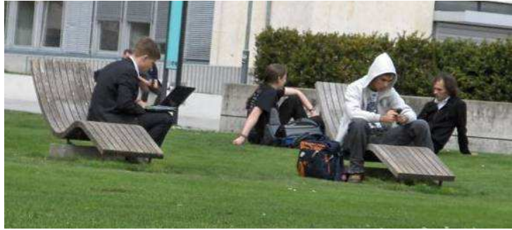
Illustration19 Accessoires électroniques: ordinateur et téléphones portables

Enfin, j'ai observé un certain nombre d'accessoires électroniques dans plusieurs chroniques. Les téléphones portables et les supports musicaux portatifs divers sont très fréquents. De nombreuses personnes signalent d'ailleurs y recourir durant leur pause-déjeuner. Les ordinateurs portables demeurent quant à eux plus rares dans l'ensemble. Ils sont aussi plus fréquents à la Grosse Schanze qu'à la Waisenhausplatz. On peut