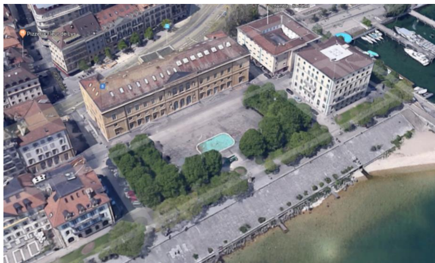
Figure 2 : Place Ostervald, avec en son centre un bassin