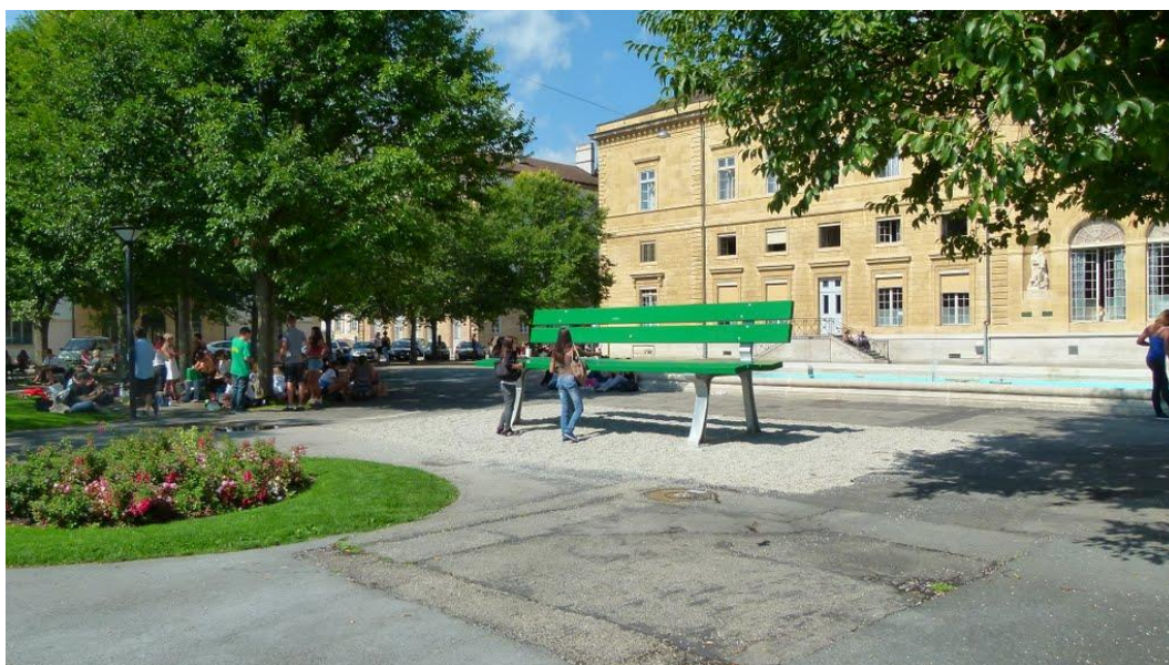
Figure 3 : Le Banc Géant de Lilian Bourgeat à la place du quai Ostervald