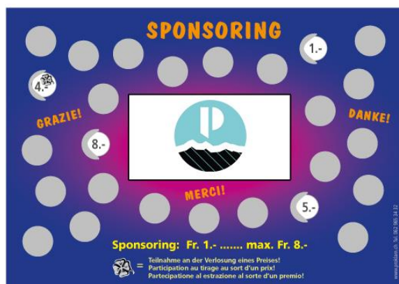
Figure 5 : Carte à gratter de sponsoring.

Afin d'obtenir de l'aide financière de nos connaissances, nous mettrons en place un système de carte à gratter de sponsoring (Figure 5) avant le début du projet.