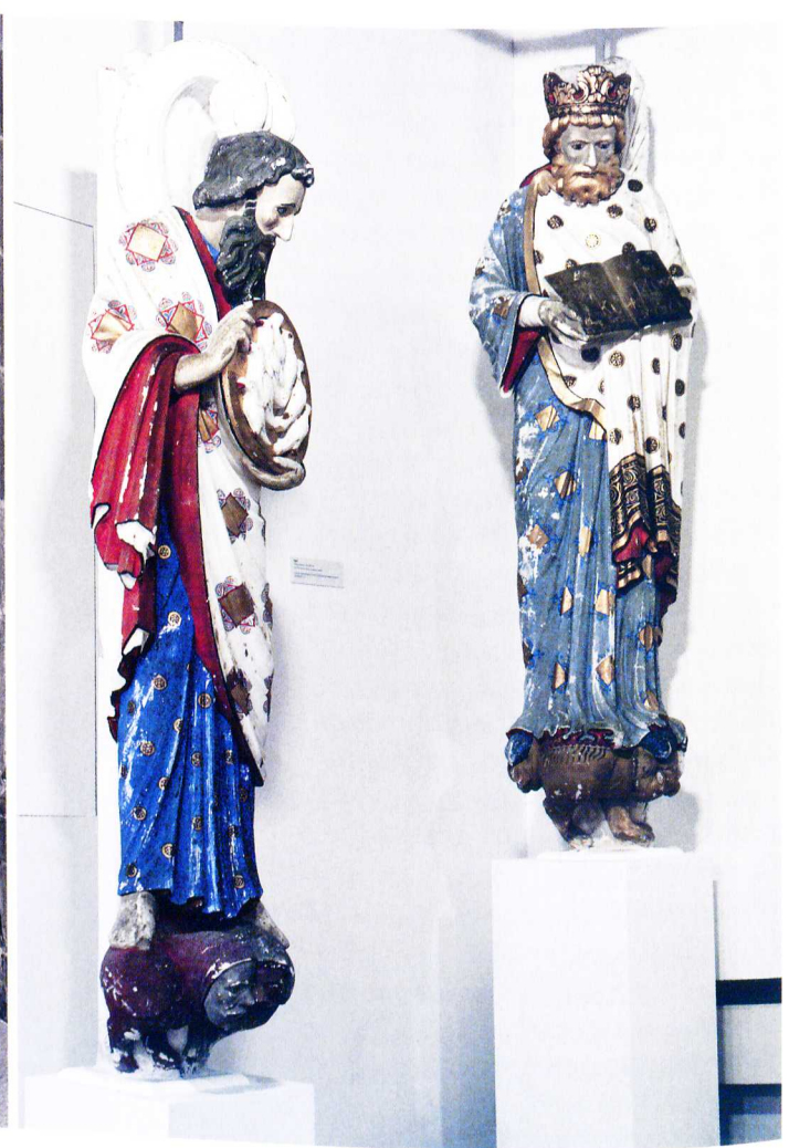
2 Copies exposées au MHL.