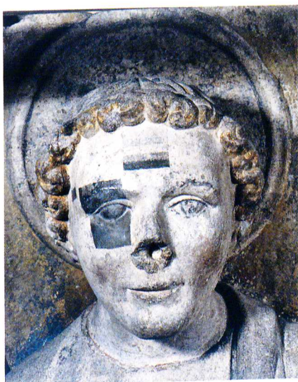
7 - 8 Archange non dégagé puis dégagé