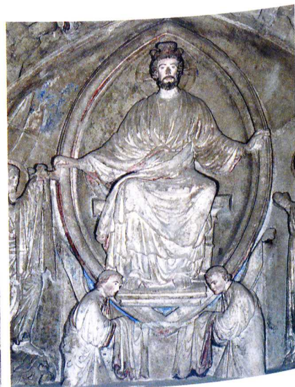
4-6 Christ dans la mandorle: avant, pendant et après restauration.