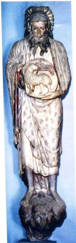
3 Jean-Baptiste exposé au MHL, août 1981.