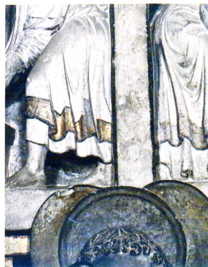
9 - 10 Linteau non dégagé puis dégagé (prise de vue entre Dormition et Assomption).

Plutôt qu'une dépose générale ou partielle de la sculpture du portail et son transfert - ou maintien - au Musée, l'aboutissement logique et idéal des efforts entrepris pour sa remise en état devrait tendre à un souhaitable retour de la statuaire entreposée en ses lieu et place d'origine, à la présentation de l'ensemble redevenu immeuble, nettoyé et consolidé à l'abri du portail, son cadre initial et complémentaire.