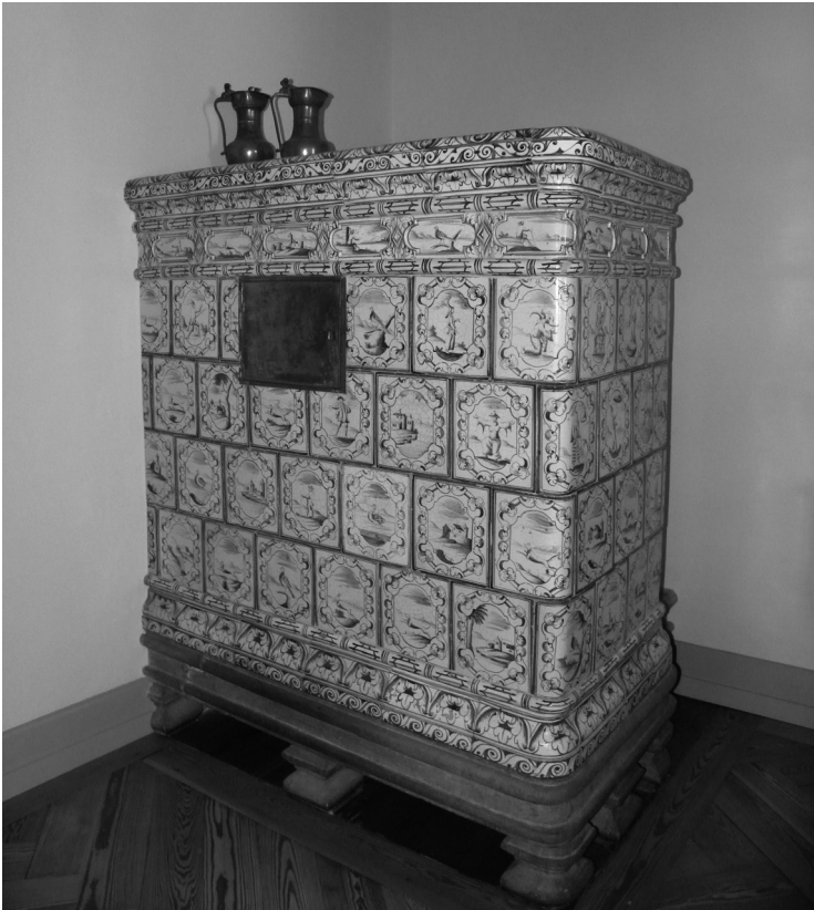
III. 1. Fourneau à catelles en faïence du xviii e siècle, Fondation Borel à Auvernier (NE) – avec banc (situé à l'angle du mur, entre la paroi murale et le fourneau).

possède de nombreux noms qui varient en fonction des régions, le terme le plus courant pour l'Arc jurassien étant platine 7 (Boschung et al. 2010 : 555, Roland 2012 : 518, Royer 1977 : 65). Il consiste en une plaque de fonte placée dans l'âtre de la cuisine qui « est amincie, afin de diffuser la chaleur du foyer à la chambre de séjour adjacente » (Roland 2012 : 430). Attestée pour la première fois en Lorraine au xvi e siècle (ALW 5, 13), la platine « constitue vraisemblablement l'unique moyen de chauffage de la chambre de séjour jusqu'à l'introduction des poêles en maçonnerie » (Roland 2012 : 434-35) dans les habitations rurales de l'Arc jurassien.