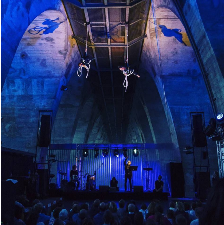
Very Bat Trip , Acte 2, Pont Butin Genève, 09 juin 2017.

Muséum d'histoire naturelle de Genève et le Centre chauves-souris CCO se sont associés autour d'un projet en deux volets, intitulé Very Bat Trip 37 . Un spectacle «grandeur nature», mis en scène sous les arches du Pont Butin à Genève et conçu à tire d'ailes, en quelques jours ultrasoniques. Sous la houlette d'Eric Linder, Fabrice Melquiot et Pascal Moeschler, musiciens, cordélistes, rendront hommage à la plus fascinante des bêtes volantes : la chauve-souris 38 .