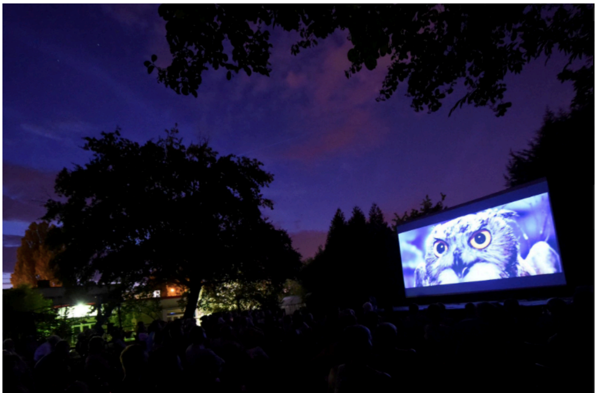
Projection Cinéma sous les étoiles Zoo de Mulhouse, 2018

Imaginez, il est 21 heures, les étoiles brillent dans le ciel, les lucioles vous éclairent et les animaux du zoo vous saluent à leur façon en vous invitant à la projection d'un film comme au cinéma, pour petits et grands. Un moment hors du commun, gratuit pour tous ! Cette année, projection du film Ernest et Célestine 46 , film d'animation de 2012.