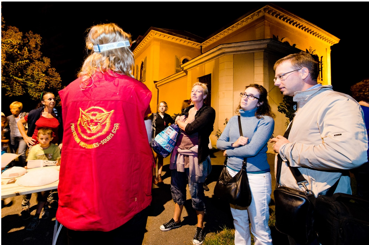
Nuit des chauves-souris au Muséum d'histoire naturelle de Genève, 2018.