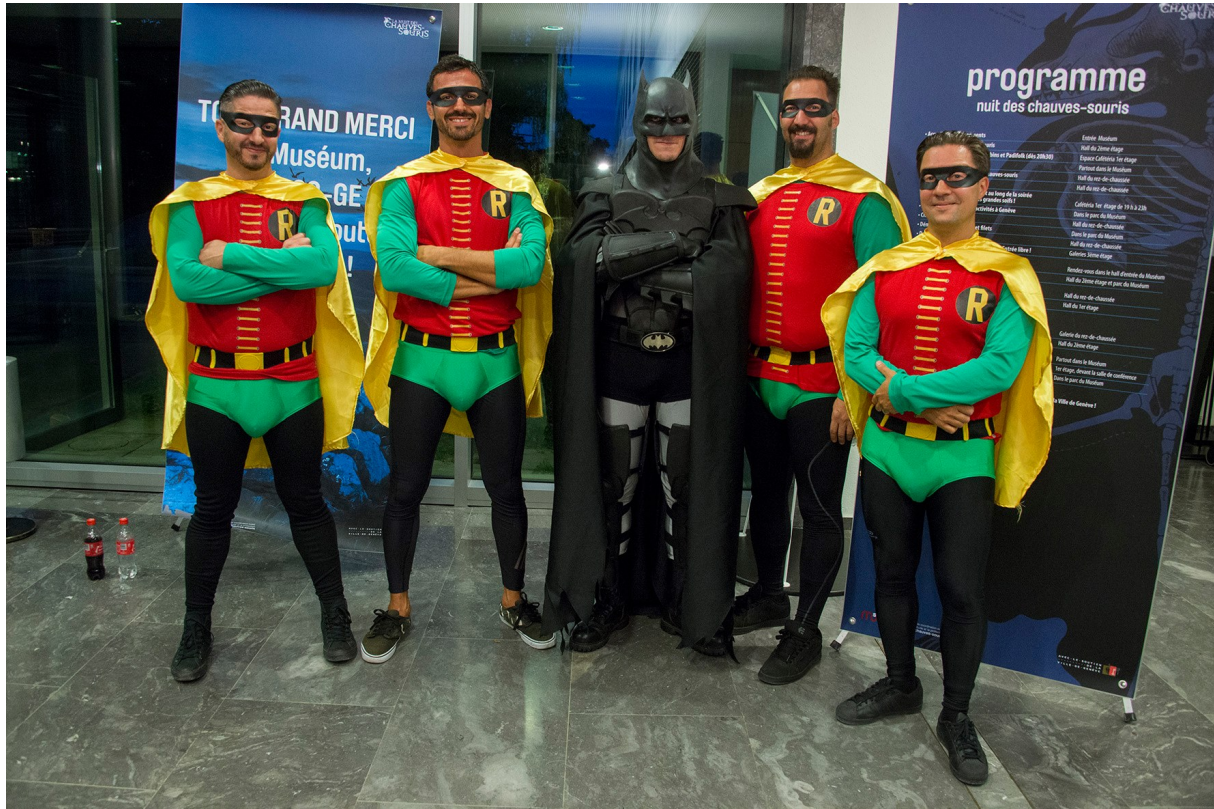
The Robins et Batman, Nuit des chauves-souris , 25 août 2017.