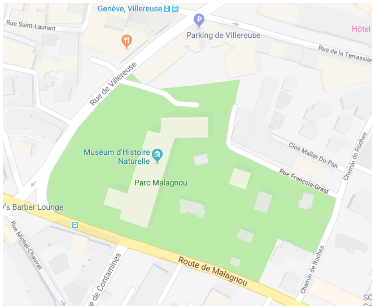
Localisation du projet Bat Movies à Genève.

Le nombre de manifestations par année peut varier. En effet, les sections régionales sont libres de choisir d'organiser ou non La Nuit des chauves-souris et jouissent également de liberté dans le choix des animations proposées. Évidemment, elles sont réceptives à toute nouvelle proposition.