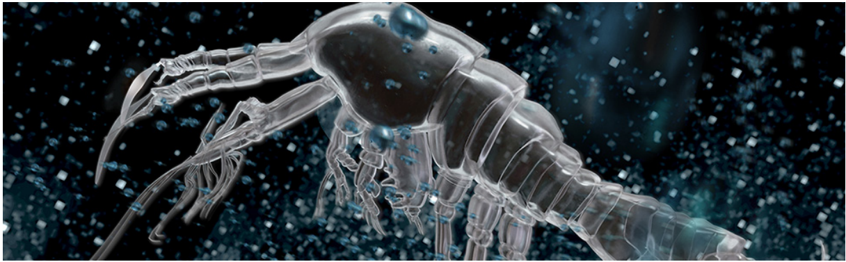
Gelyella Monardi , visualisation 3D.

La première difficulté consistait à trouver la manière de « rendre visible » un animal invisible à l'œil nu et après, il fallait trouver ce que nous souhaitions dire dessus. Que nous disait l'animal sur lui-même et sur son environnement, que souhaitions-nous véhiculer ? C'est là que le concept de bio-indicateur culturel 34 a pris tout son sens, car si cet animal, aussi petit soit-il, présent sur Terre depuis plus de 20 millions d'années, était amené à disparaître parce que nous n'avons pas su ou voulu agir, que nous dirait cette situation sur notre niveau de culture, voire notre niveau d'humanité ?