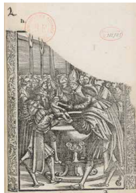
Fig. 1 Nicole Volcyr de Sérrouville, Baptême de Nicolas-Monsieur, filz puis-nay de Mgr. le duc Antoine [de Lorraine] , Saint-Nicolas-de-Port, Jérôme Jacobi, 1524, Paris, Bibliothèque nationale de France, Rés. LK2 3719, frontispice

Au sortir de cette pièce, les hérauts d'armes répartissaient les invités en un cortège qui allait emmener l'enfant du château à l'église. Toute la cour était mise en scène dans cette pro-