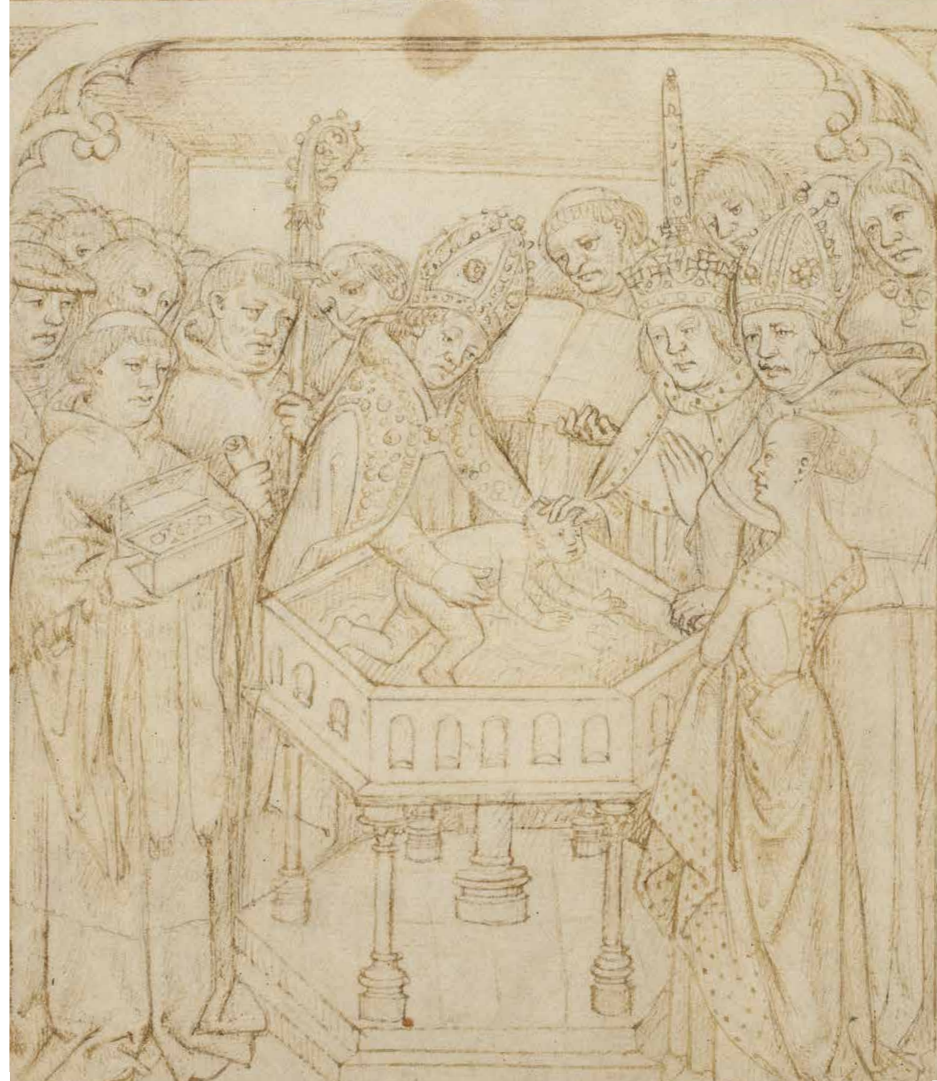
Fig. 5 Beauchamp Pageants, vers 1485, Londres, British Library, MS Cotton Julius E IV, fol. 1 : Le baptême de Richard Beauchamp, comte de Warwick

À la fin du xv e siècle, la naissance des enfants princiers prit une dimension politique et publique de plus en plus affirmée dans les milieux de cour 1 . En conséquence, l'écart temporel entre la venue au monde et la célébration du baptême se creusa. Depuis le xiii e siècle, l'Église préconisait le baptême quamprimum , soit dès que possible après la naissance. Selon la doctrine chrétienne, si l'enfant mourait sans avoir reçu le sacrement, il était condamné à errer éternellement dans les limbes sans pouvoir accéder au paradis. Dès lors, les nourrissons étaient portés sur les fonts dans les trois premiers jours de leur existence, cela dans toutes les catégories sociales – sauf une, la très haute aristocratie. Au cours du xvi e siècle, les quelques jours séparant la naissance des princes de leur baptême se transformèrent en semaines, en mois, voire en années : le futur Louis XIII avait ainsi presque cinq ans lorsqu'il fut baptisé, à Fontainebleau en 1606. Pendant cet intervalle, le salut des enfants princiers était tout de même garanti par l'ondoieusement – un « baptême d'urgence » reconnu de guerre lasse par l'Église. Dans les milieux royaux, l'usage voulait que les enfants soient dotés de plusieurs parrains et marraines, choisis selon de savantes équations politiques parmi les têtes couronnées d'Europe. Ils étaient ainsi les filleuls de souverains, de princes et de princesses des cours