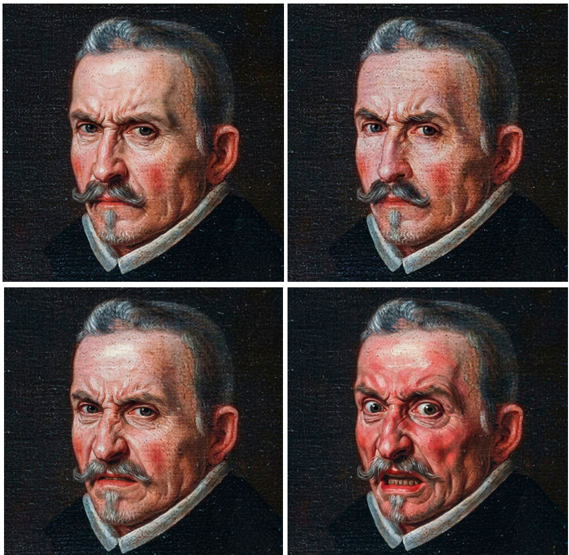
Los cambios de humor y estado de ánimo del Fénix de los Ingenios