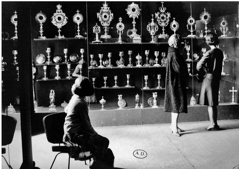
1. Trésors des églises de France , Paris, Musée des arts décoratifs, 1965

l'ici-bas, mais aussi avec l'au-delà. Le trésor désigne donc bel et bien le lieu d'une concentration de «preciosa», mais celle-ci se situe dans le registre de l'épiphanie: brièvement, s'il est une interface entre l'en-haut et l'en-bas, le trésor est l'occasion d'une accumulation spirituelle, au sein de laquelle peuvent prendre place des échanges symboliques. Les muséographies qui mettent en scène des objets de trésor tendent à privilégier la concentration, l'accumulation des choses précieuses dans un espace occupé de façon optimale, au détriment de la dimension épiphanique. L'exposition consacrée aux trésors des églises de France, organisée en 1965 au Musée des arts décoratifs de Paris par Jean Taralon, qui a provoqué une multiplication décisive des réarrangements de trésors ecclésiastiques depuis, en est un exemple remarquable: elle privilégiait en effet la typologie et la série dans lesquelles chaque spécimen trouvait sa place (ill. 1). 11 De telles présentations, caractéristiques des décennies d'après guerre, relèvent d'une muséographie accumulative, inspirée probablement des gravures illustrant la monographie que Dom Michel Félibien consacre à l'abbaye de Saint-Denis. De