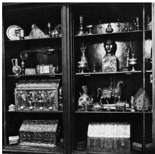
4. Abbaye de Saint-Maurice d'Againe, Armoire du trésor, photographie vers 1907

Le XII e siècle signale un passage au visuel, qui se remarque entre autres dans la nouvelle ap-