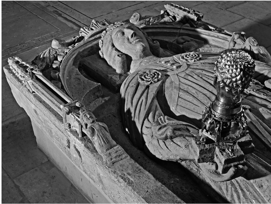
5. Selm-Cappenberg, St. Jean Evangéliste, Tombeau d'Otton de Cappenberg avec le chef reliquaire de Frédéric Barberousse

faits et gestes non seulement en rappelant les bienfaits portés à la communauté, mais en ravivant ses donations passées par l'exposition des objets à lui rattachés: des scénographies permettent ainsi de mettre ponctuellement en évidence ces bienfaits, par l'intermédiaire d'objets, le plus souvent d'objets conservés dans le trésor de l'église.