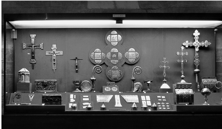
2. Trésor de la Cathédrale de Troyes, salle basse, vitrine 1, photographie de 2003

mettent de maintenir au centre du propos ce qui fait le cœur du trésor médiéval, la relique.