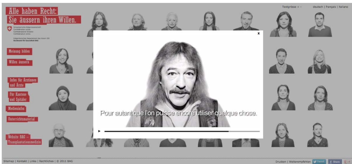
Fig.2: exemple de séquence audiovisuelle.

Pour accéder aux séquences audiovisuelles, il suffit de cliquer sur l'une des vignettes et la séquence apparaît en surimpression de la page principale.