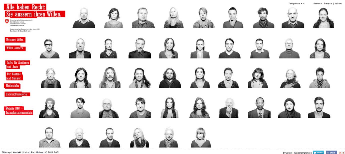
Fig.6: la page internet transplantinfo.ch (second exemple).

Si l'on s'intéresse plus en détail aux ressorts sémiotiques et discursifs organisant la scénographie proposée (Maingueneau 2007: 60-66), il faut tout d'abord s'arrêter sur un premier énoncé dont la mise en évidence en fait un élément organisateur de la prise de parole: il est placé en haut à gauche, c'est-à-dire en début de parcours de lecture, et a une taille de police typographique plus importante que les autres énoncés. Cet énoncé est associé à un émetteur institutionnel: l'OFSP, comme l'indique le logo "Confédération suisse / Département fédéral de l'intérieur/ Office fédéral de la santé publique". Il désigne des individus, catégorise et évalue (voire encourage) une activité de parole: