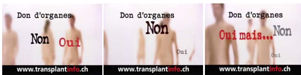
Fig.3: le spot télévisé 2008, partie 1.

Très schématiquement, le spot télévisé de 2008 articule des voix s'échappant du murmure d'une foule et des images représentant des formes humaines sur lesquelles apparaissent en surimpression les mentions suivantes "Don d'organes", "Oui", "Non", "Oui mais...", comme ci-dessous: