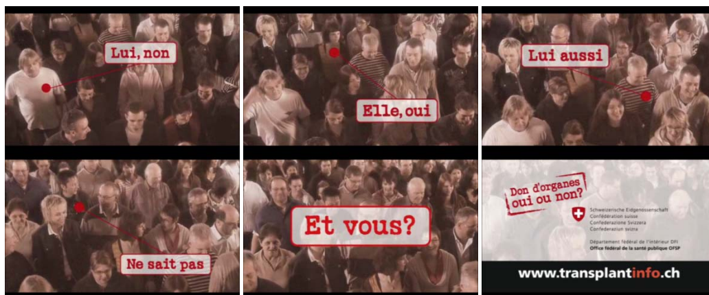
Fig.5: le spot télévisé 2009.

Le spot télévisé de 2009, quant à lui, met en scène une foule en mouvement de laquelle s'échappe un murmure. Accompagnées de quelques arpèges joués par un piano, apparaissent tout à tour des étiquettes reliées à chaque fois à un individu différent. Les étiquettes contiennent les énoncés suivants: "Lui, non", "Elle, oui", "Lui aussi", "Ne sait pas". Une dernière étiquette – qui, elle, n'est reliée à aucun individu représenté à l'image – contient l'énoncé suivant: "Et vous?".