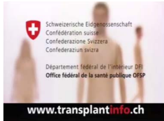
Fig.4: le spot télévisé 2008, partie 2.

A la fin du spot, le murmure de la foule s'éteint et apparaît en surimpression le logo de la Confédération suisse et la mention de l'OFSP.