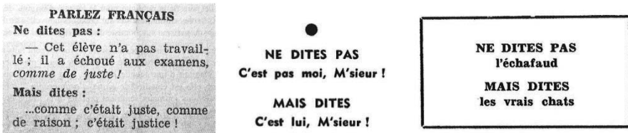
Illustration 1 : À gauche, exemple de 'mini CdL' sur le modèle des cacologies, parue dans Le Jura Libre (9 août 1961, p. 2) et 2 exemples de parodies (Franquin et Jidéhem 2018 : 10 et 23 ; publiées en 1968)

Cette définition « extensive » permet de prendre en compte des publications très fréquentes dans la presse du début du XX e siècle, disparues aujourd'hui. On publiait souvent dans ces journaux de minuscules encarts qui reprennent le format bien connu des cacologies : « ne dites pas... mais dites... ». Ils sont utilisés de façon aléatoire avec d'autres (citations, slogans publicitaires), certainement pour 'boucher' un blanc dans la mise en page. On en trouve par exemple un assez grand nombre dans l'hebdomadaire suisse le Jura Libre (Cotelli Kureth 2015 : 257). On ne sait pas qui a écrit ces textes dont les informations sont certainement empruntées à des recueils de fautes antérieures. Ces mini-CdL participent toutefois également au discours sur la