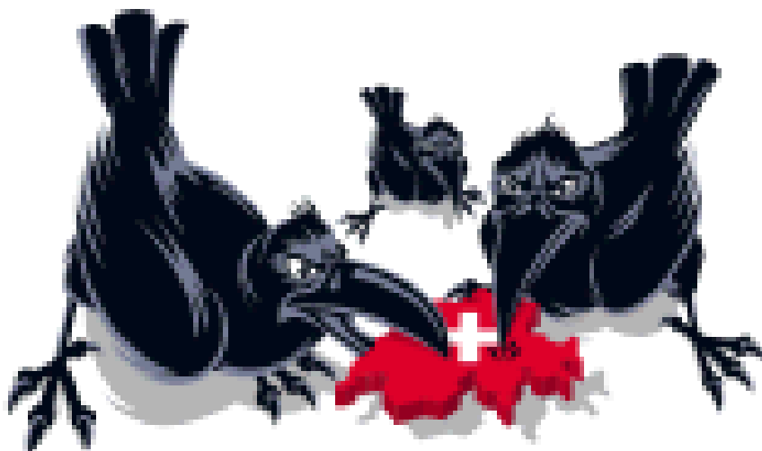
Figure 1 : L’affiche de l’UDC dans la campagne référendaire

«Ouvrir la porte aux abus ? Non !», UDC, 2009