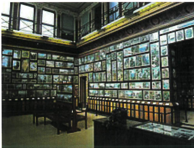
La Marianne North Gallery a Kew.