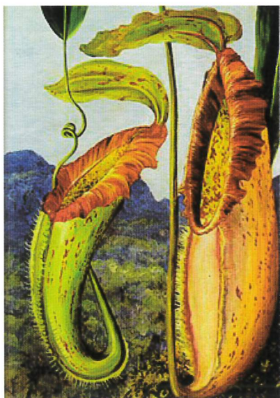
La Nepenthes Northiana, illustrata da Marianne North

Questo estratto di una guida di viaggio recita : «Hier kann man Pferd un Führerfür den Besuch der Valle d'Ispicaerhalten», cioè qui [a Spaccaforno] si può usufruire del servizio di un cocchiere e un cavallo per una visita della valle d'Ispica.