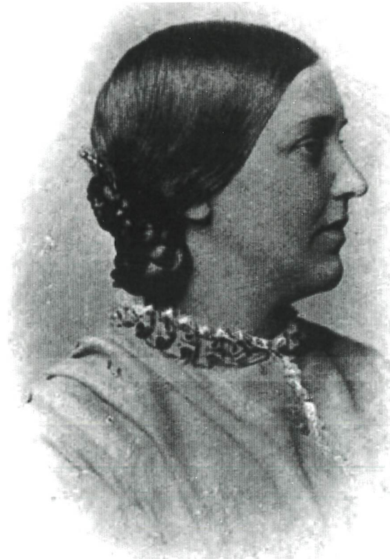
Marianne North intorno al 1865.