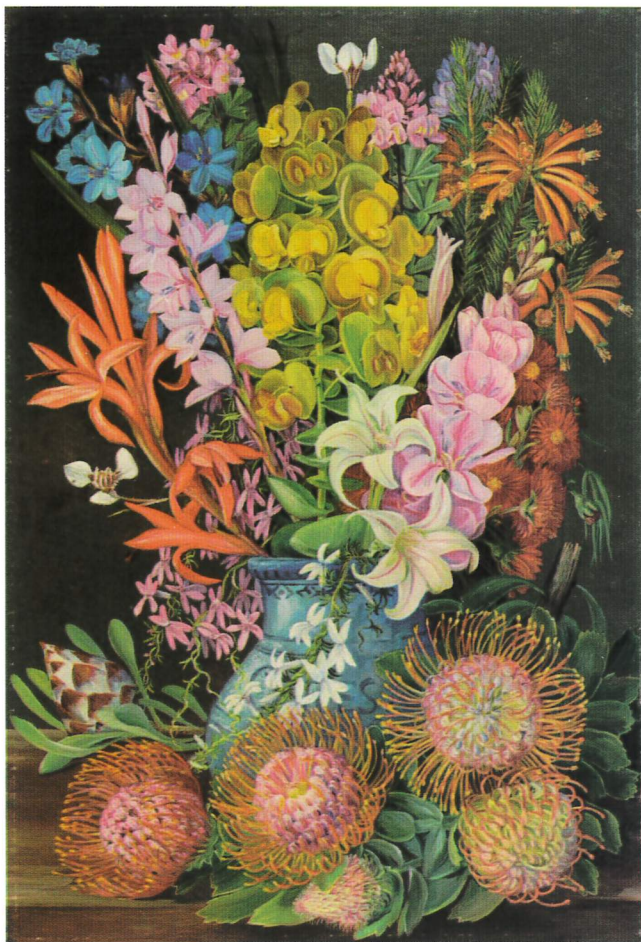
Una tipica composizione floreale illustrata da Marianne North.