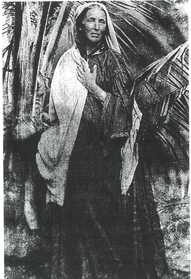
Marianne North nella sua casa di Ceylon